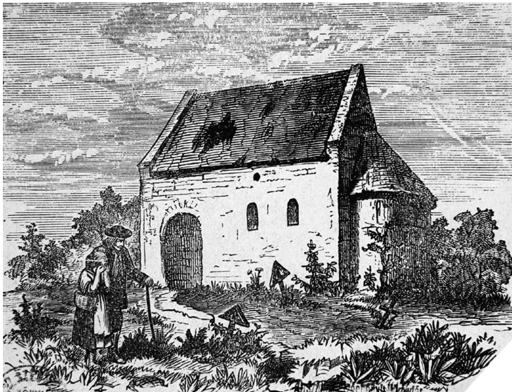
A kehidai temetőkápolna, a Deák család sírboltja

is példás pontossággal és igazságszeretettel szolgálta megyéjét. Országgyűlési követként egyaránt kivívta hazája és királya elismerését, mindkettőt egyformán szerette, és mivel meggyőződése szerint szolgálataival csak hazafias kötelességét teljesítette, nem fogadta el a királyi tanácsosi kinevezést. Zalában az „alkotmányos szabadelműek” táborához tartozott, vezérelve a magyar nemesi szabadság fenntartása és az alkotmány (kora kívánalmainak megfelelő) módosítása volt. Értelmi súlya előtt még politikai ellenfelei – köztük az öccse, Ferenc – is meghajoltak, beszéde „rövid, szabatos, világos, nem sértő, nem szeszélyes, nem cifra, hanem komoly” volt. 16