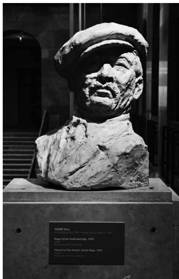
Szabó Vera: Nagy István festő festő portréja

Jellemzően az 1960-as évek közepétől a magyarországi értelmiség és az érzelmileg elkötelezett emberek színe-java, lehetőségeihez mérten és még azon fölül is mindent megtett azért, hogy odaforradulással, cselekedeteivel segítse az ottani kultúra továbbélését. A művészetnél