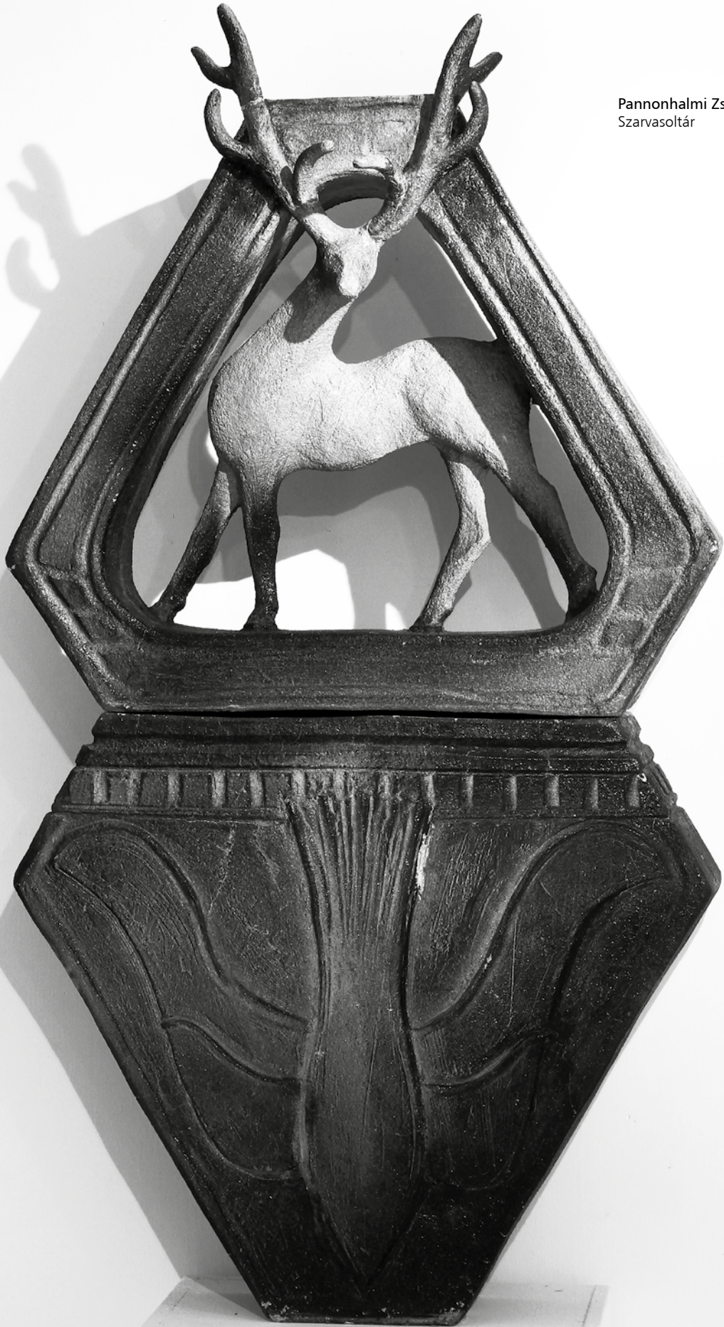
Pannonhalmi Zsuzsa: Szarvasoltár