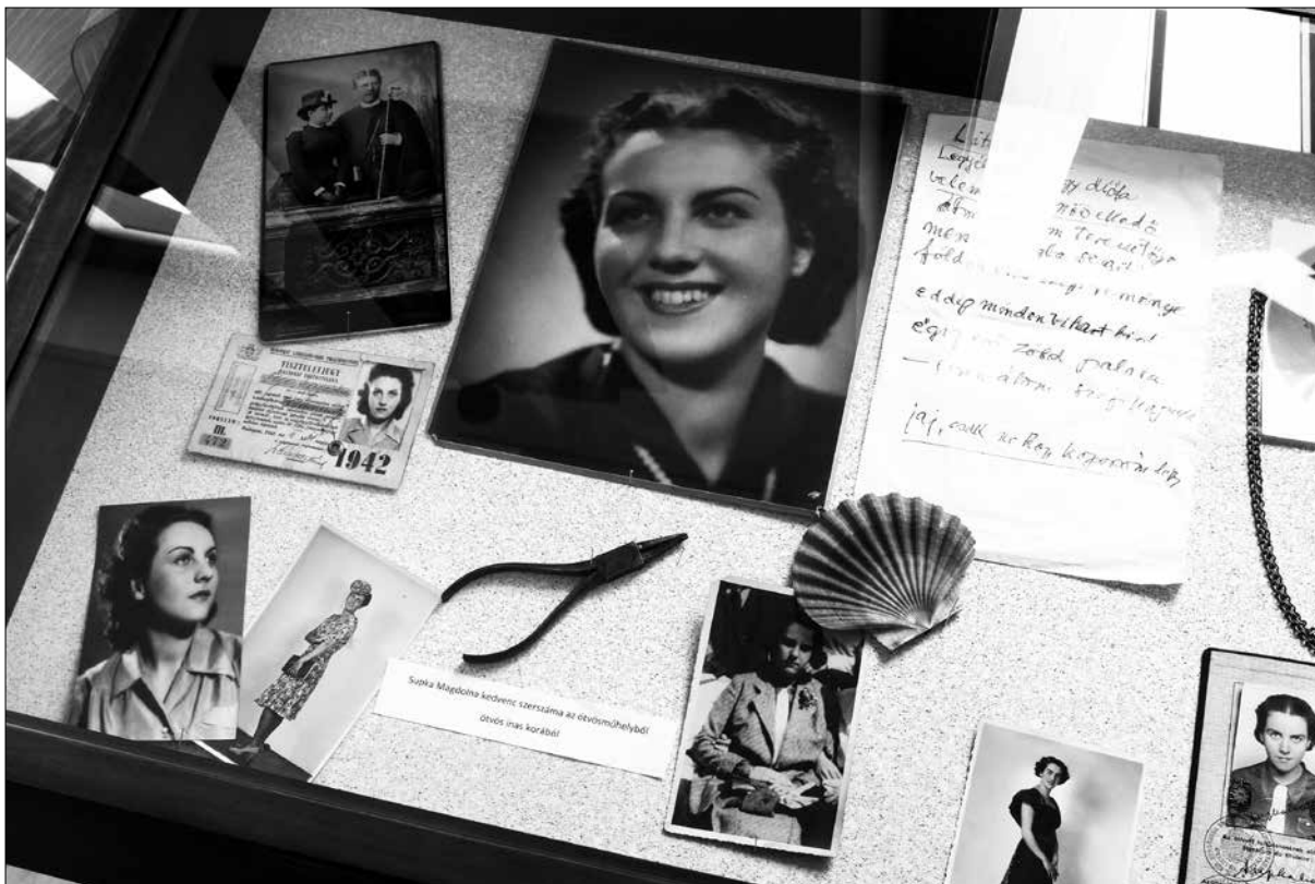
Részlet a kiállításból...

fizikai és szellemi jelenlét kontrollálását, a részvétel fontosságát hangsúlyozó itt vagy még-kérdés az utolsó hosszú-hosszú telefonbeszélgetés, illetve számomra inkább telefonhallgatás lezárulása óta meghatározza Supka Manna-élményeimet és -emlékeimet.