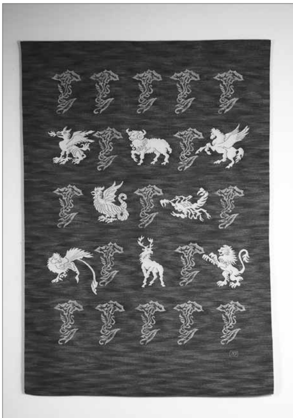
Nagy Judit: Predestinatio III.

munkás, Felvonulás, Béke. Művészetének egyedi, hangsúlyos jellemzőjeként el kell mondani, hogy tudatosan használta a kárpitoknál a bordúrt, mellyel keretbe foglalta és felerősítette műveinek hatását. 1916-tól rendszeresen állított ki. Családi tárlatokon, a nagybányaiak bemutatkozásain, testvérével, Béni-vel, majd önálló hazai és külföldi bemutatókon folyamatosan szerepeltek munkái, amelyeknek jelentős része külföldi köz- és magángyűjteményekbe került. 1930-ig Erdélyben, majd haláláig Budapesten dolgozott. 1950–1957 között az Iparművészeti Főiskolán tanított kárpitszövést, átadva hatalmas és egyedi tudását.