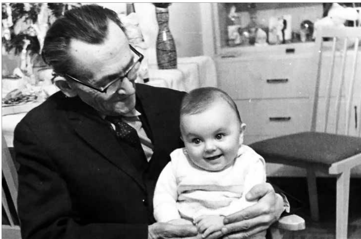
Édesapám a legújabb nemzedék első képviselőjével

Ennyi. Már nem fejezhettem be, nem finomíthatta, nem csiszolhatta – rövidesen, 1969. október 29-én a zalaegerszegi tüdőkórházban szívós szervezete feladta a már évtizedes küzdelmet a zárka hidegében rátámadt betegségeivel. Mégis úgy érzem, a történelmi poklon, a személyes sárba tiprásán is túllépő, felülemelkedő, utolsó pillanatáig bizakodó életerejének e megnyilvánulása a legmélyebb, legmúltóbb idézet, hogy lezárjam a megelőző nemzedékek üzeneteinek sorát.