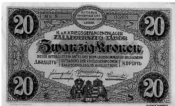
A zalaegerszegi cs. és kir. Hadifogolytábor szükségpénzei (Göcseji Múzeum)