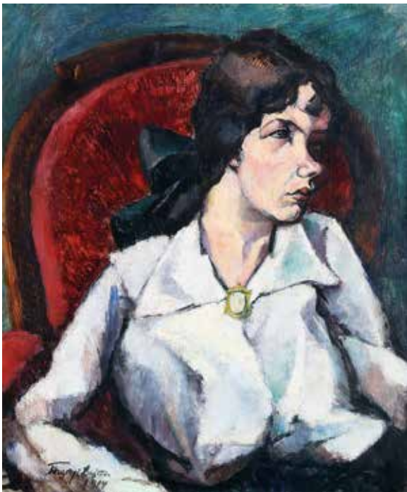
Tihanyi Lajos: Leánykép (Leopold Magdolna portré)