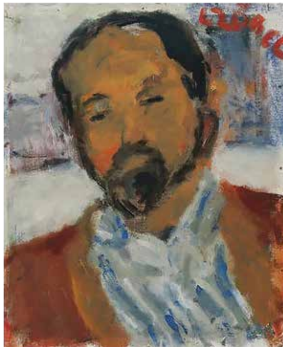
Czóbel Béla: Deák Dénes portréja

Múzeumban elárvereztették a hitelezők. Bár hitelezőit sikerült kielégítenie, vagyona elúszott, a veszteséget méltósággal viselve, visszavonult könyvei közé, s pár évvel élte túl csak az elváltat kedves gyűjteményétől. De akadnak pozitív példák is. A rendszerváltás után Svédországból hazatért, ismert vállalkozó és műgyűjtő, Takács Lajos a kilencvenes