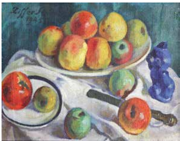
Ziffer Sándor: Csendélet almákkal és kék szoborral