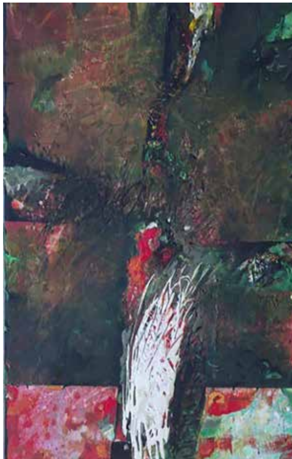
Nemes László: Zöld Galaxis 2013