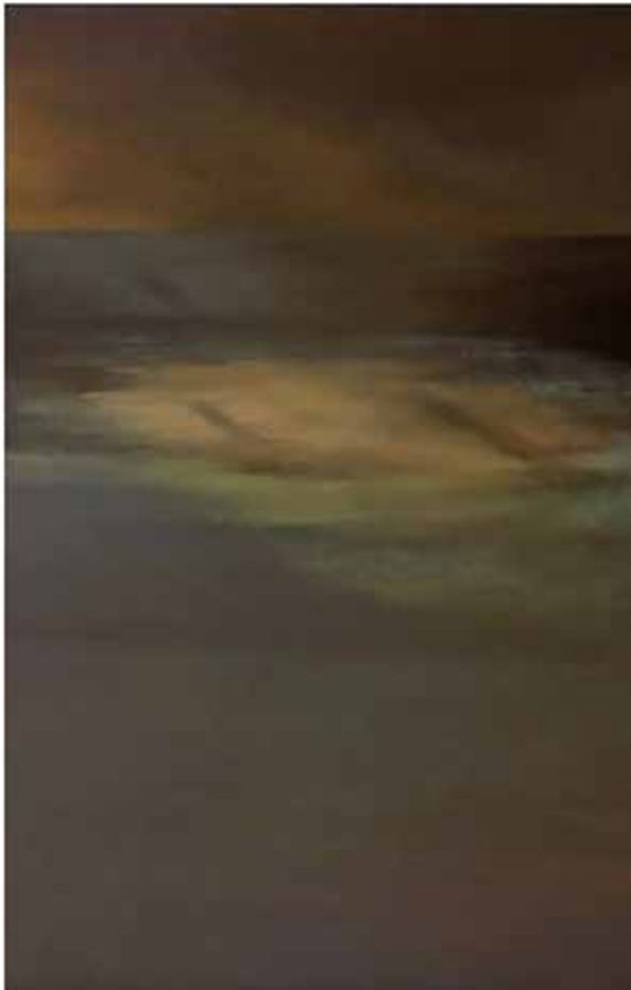
Lányi Adrienn: Visszfény 2013