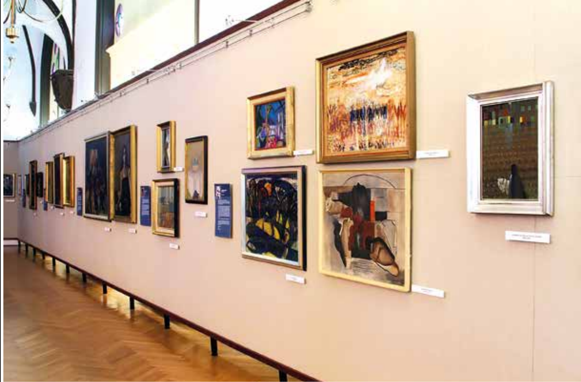
Enteriőr a Deák Dénes Gyűjtemény zalaegerszegi kiállításáról