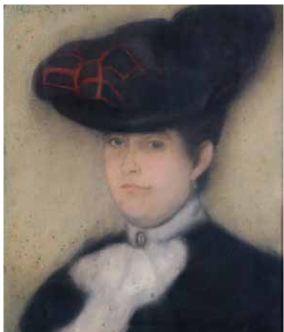
Rippl-Rónai József: Bruckné ténasszony