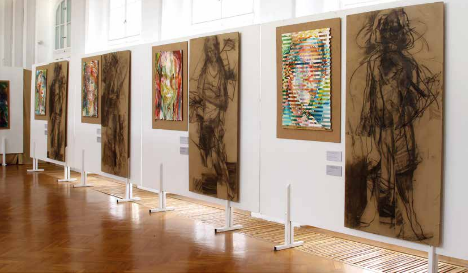
Kiállítási enteriőr a Balatoni Múzeumban - Keszthelyen