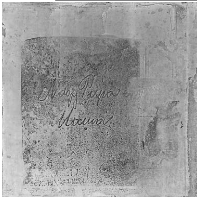
Báti Sándor: Könyvtárak I-II. 2012

Különben is: nekünk, egyeseknek, előbb-utóbb eszünkbe fog jutni, bárcsak úgy adatott volna, hogy lenne egy nővérünk.