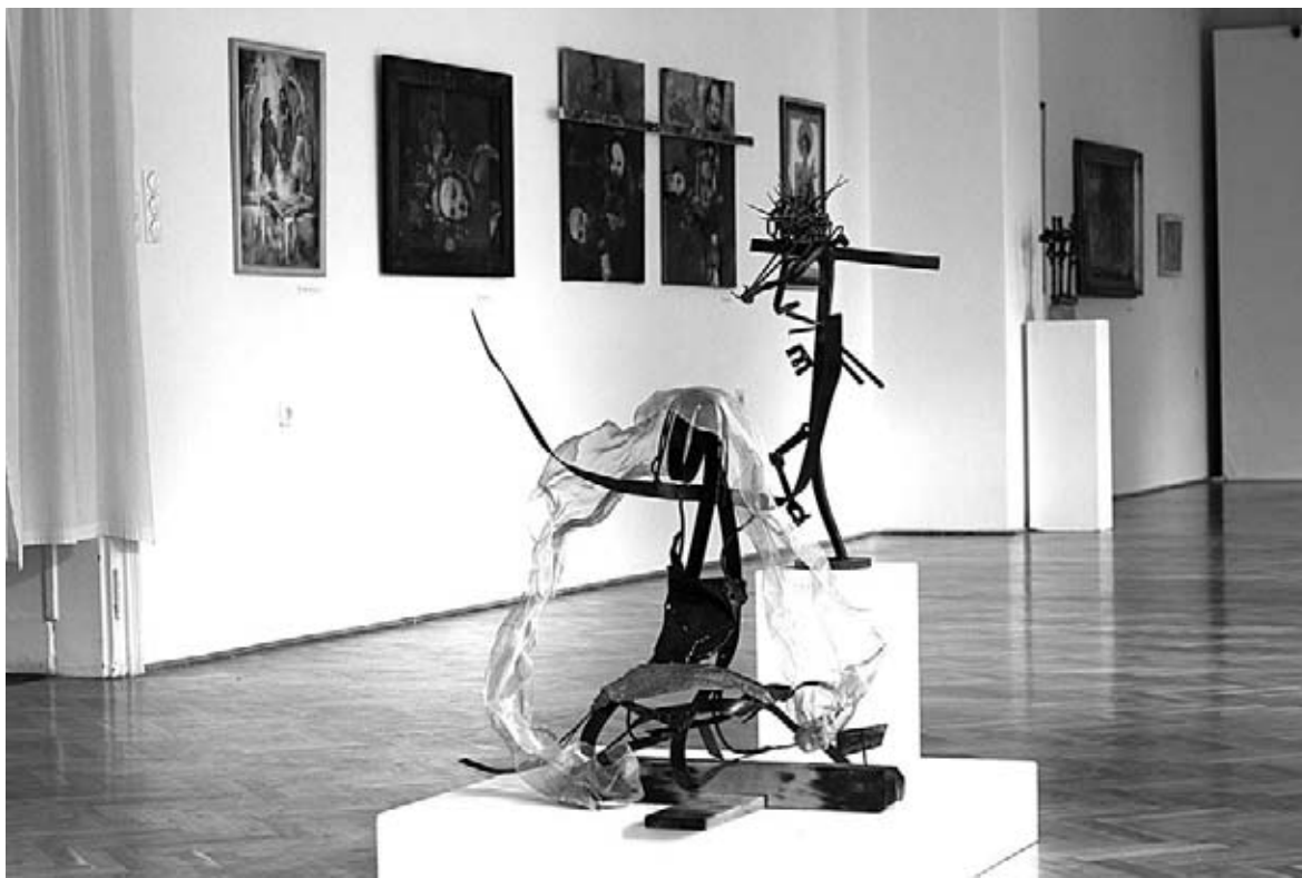
Enteriőr a "Keresz alatt" című kiállításról

Ilyen előzmények után meglehetősen merész vállalkozás volt a Vitrin Művészeti Egyesület és Göcseji Múzeum felhívása a megye és régió művészeihez, hogy adjanak be munkákat A keresz alatt című tematikus tárlat megrendezése érdekében. Húsvét táján ennek van aktualitása, de a kurátorokat nem ez foglalkoztatta. Egyszerűen