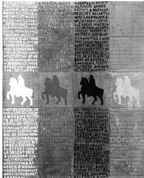
Budaházi Tibor: Az Apokalipszis négy lovasa

válik meghatározóvá. S mind aprólékosabb kidolgozású felületekkel találkozunk, a csónak alakú fejfák hullámzó sorozatokba rendeződnek, hol színesek, hol fekete-fehérek, a vizuális ritmus vezérli a képalkotó elgondolásait. Szépek és ihletettek a kereszt-formációk, a meglepő sárga színárnyalatokkal. Az egyiptomi kereszt emlékeztet leginkább az emberi alakzatra, s Budaházi az ebben rejtőző lehetőségeket állítja elénk több variációban. Az Alak sorozat a szindinamika játékaival kápráztat el, míg az aranyfestést is felhasználó művészkönyvtörredék a szakrális tartalmakra utal. Feltűnik a labirintus is, mint a rejtélyek örök szimbóluma. S mindezeket a formációkat (Isten szeme, négyzet, háromszög) a jellegzetes budaházis írásmező, kalligrafikus hullámváz veszi körül, sajátos érzéki keretként.