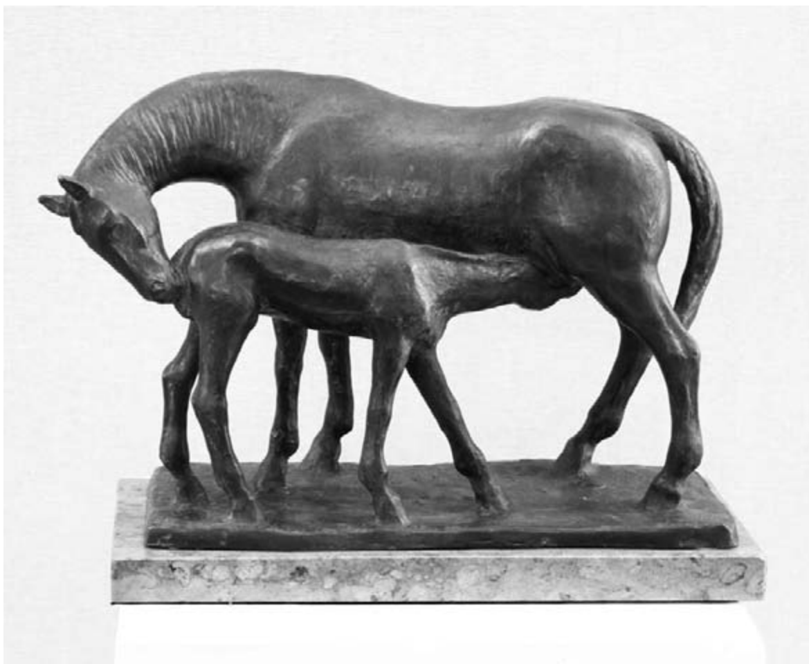
Andrássy Kurta János: Csikót szoptató ló

is láthattuk. Városunkban immár maradandóan jelen van, hiszen az erőteljes fríz alakjai vonzzák a tekintetet, és ha az előtte elhaladó ember az utcán egy pillantást vet a domborműre, óhatatlanul a szépség bűvkörébe kerül. Ő tudta, a művészet nem stílus, nem divat és nem politika. Művésznek lenni egy életforma, amivel ez életre eljegyezte magát. Mai hatásának is ez az egyik titka.