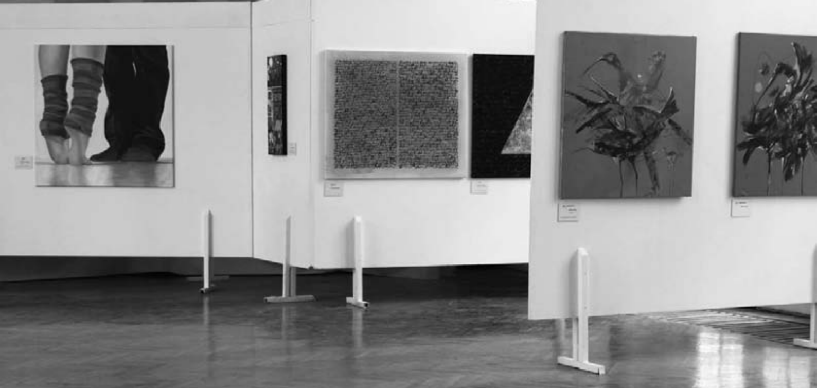
Enteriőr a kiállításról