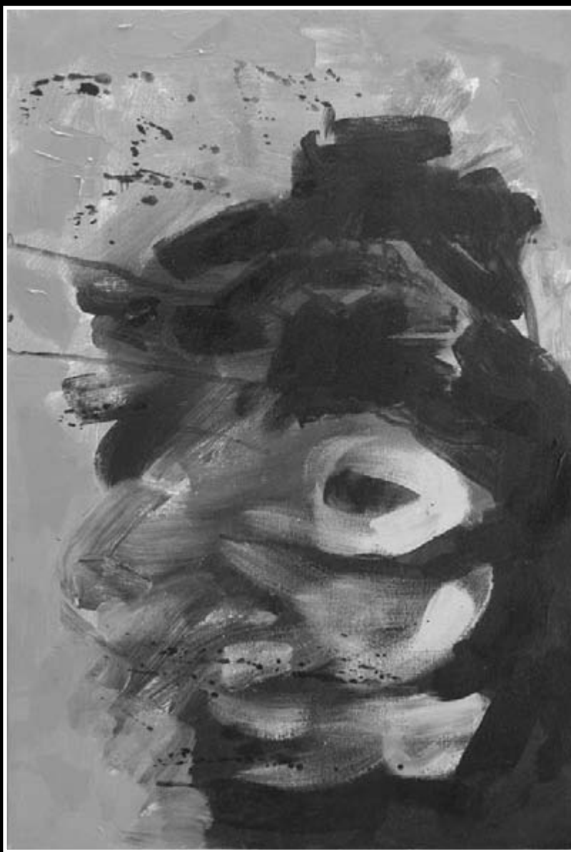
F. Balogh Erzsébet: A hurok marad II.

2011. 08. 12., Zalaegerszeg, Kézművesek Háza)