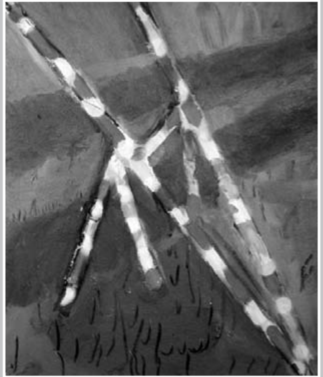
Szentgróti Dávid: Sorompók - 2010