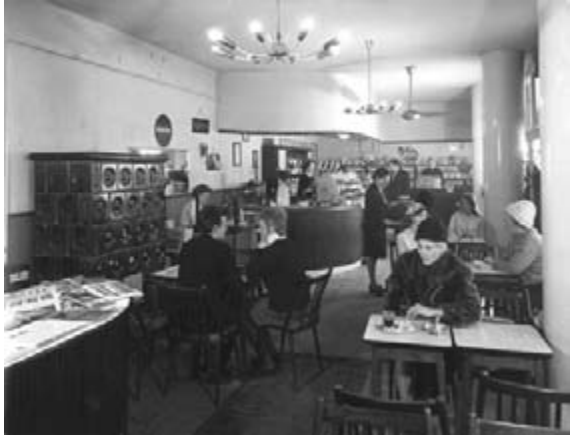
A Pontház földszintjén kialakított cukrászda belsője a hatvanas évek végén