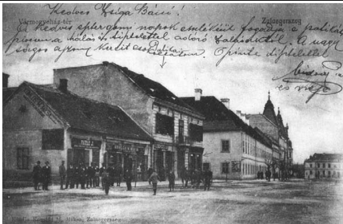
A Pontház helyén egykoron állt régi épületek