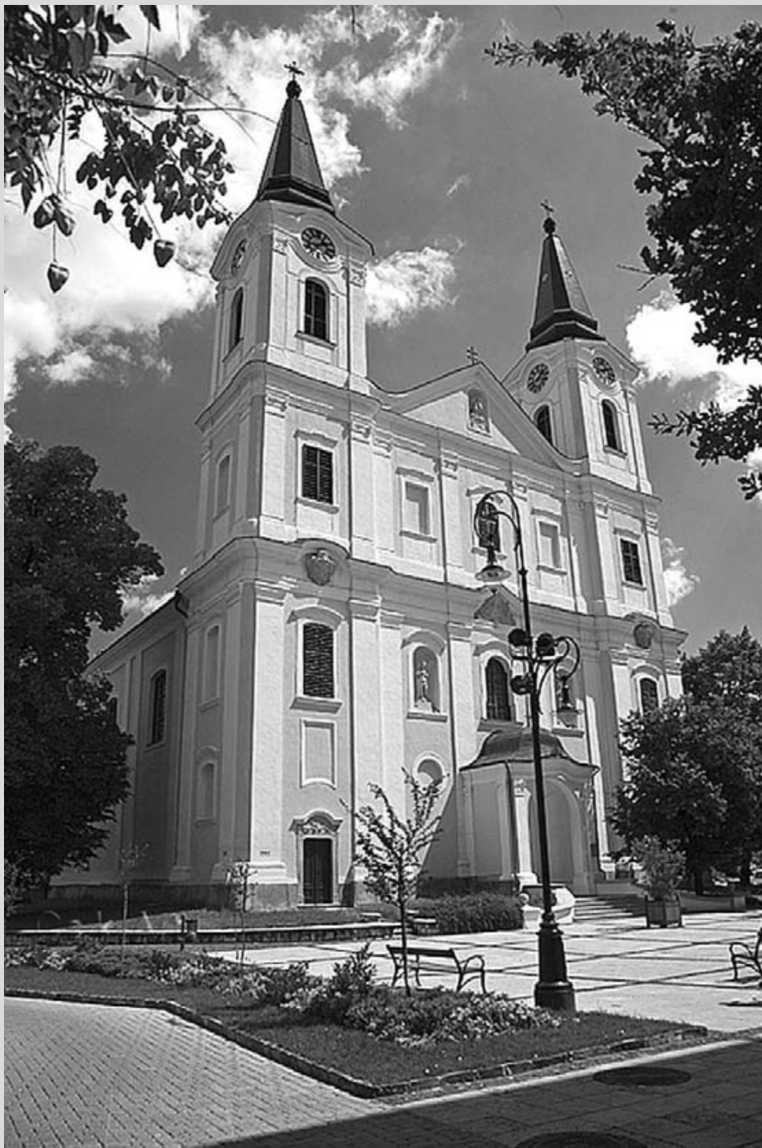
Mária Magdolna templom - Zalaegerszeg