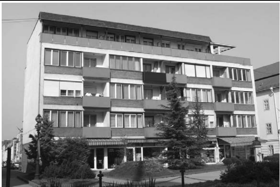
A Pontház mai képe

helyeződött, ezért a tetőemelet áttervezésével a mosókonyha és a szárítók helyén egy újabb lakást alakítottak ki, így a földszinti házfelügyelőivel végül 16 lakásos lett az épület.