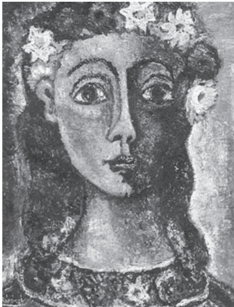
Basil Rákóczi: Femme aux Fleur -1951

Rákóczi rajzainak egy gyűjteménye Ausztráliában, a Queensland Art Galleryben található. (Lucy Wertheim ajándéka) 1971-1972-ben Rákóczi Bretagne-ban dolgozott, akkor alkotott képeiből jutott néhány Franciaországba, Hollandiába és Monacoba is. Néhány könyvet is illusztrált, melyek Párizsban jelentek meg White Stag Press impresszummal. Az észak-ír Ulster Múzeumban kép képe található, a Chez les Sinclair és a Nature Morte au Telephone . A dublini Irish Museum of Modern Art-ban ugyancsak két festménnyel szerepel, a Child és a Child Flying , melyek elsőként az 1944-es kiállításon szerepeltek. Az ötvenesektől a hetvenes évekig Rákóczi többször visszatért Írországba, részint kiállításai révén vagy azért, hogy ismét az Aran