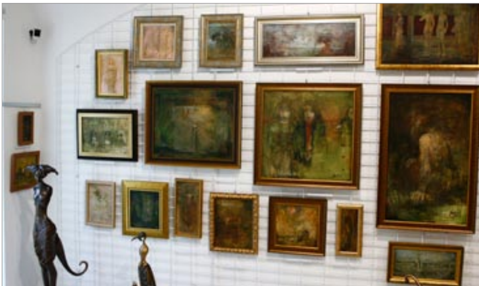
Enteriőr a Petro Galéria kiállításról