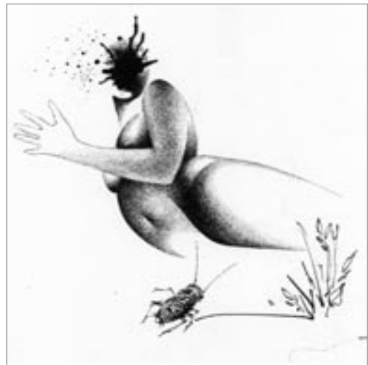
Antik szerelem (illusztráció)