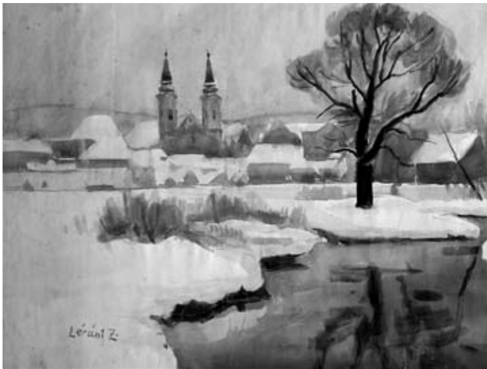
Léránt Zoltán: Zalaegerszeg téli látképe