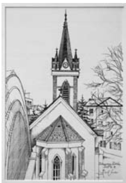
Bedó Sándor: Evangélikus templom