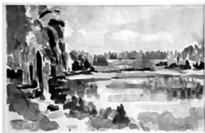
Tánczos György: Gébárti vízió