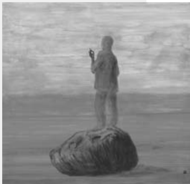
Takács Tamás: Térrerő, olaj, vászon