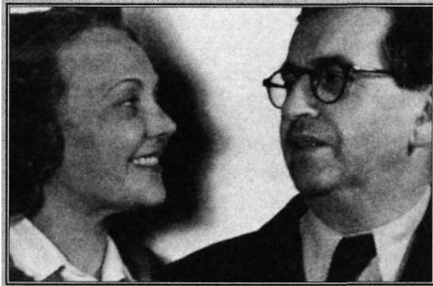
A szülők, Székesfehérvár, 1940-es évek

- Igen, de más beállítottságú újságra is tudok példát. Például a Friss Újság.