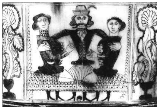
Mulató betyár - sótartóra karcolt dísz

A betyárok tetteiről, viselt dolgairól szívesen emlékezik a nép. Dalaiban, meséiben a betyárokkal kapcsolatban is szabadságvágyát testesíti meg. E miatt válik aztán idealizálttá, romantikussá a betyár alakja. Mivel a ponyvairodalom is hálás témát talált a betyártörténetekben, ezért széles körben terjedtek. Főleg az országos híru betyárokról van sok adat, a helyi, kisebb közösségek által ismertekről alig-alig.