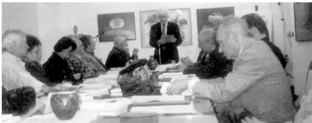
A lendvai vár tanácstermében az írótalálkozó résztvevői. Képünk a Népújság XLIV. évfolyamának 48. számából való

részeként születtek, nem az egyetemes olvasó normáira sandítva. Ha az irodalom hagyja eluralkodni magán az egyetemesség abszurd, csak kereskedelmi szempontból értelmezhető szigorú követelményét, akkor arra a mezőre jut át, amelyet a szappanoperák és az akciófilmek urálnak, hiszen egyetemes fogyasztásra ezek a legalkalmasabbak. Egy afrikai nomád törzs például néhány éve elhalasztotta az indulást szokásos vándorútjára, amelyet mindig ugyanannál a csillagállásnál