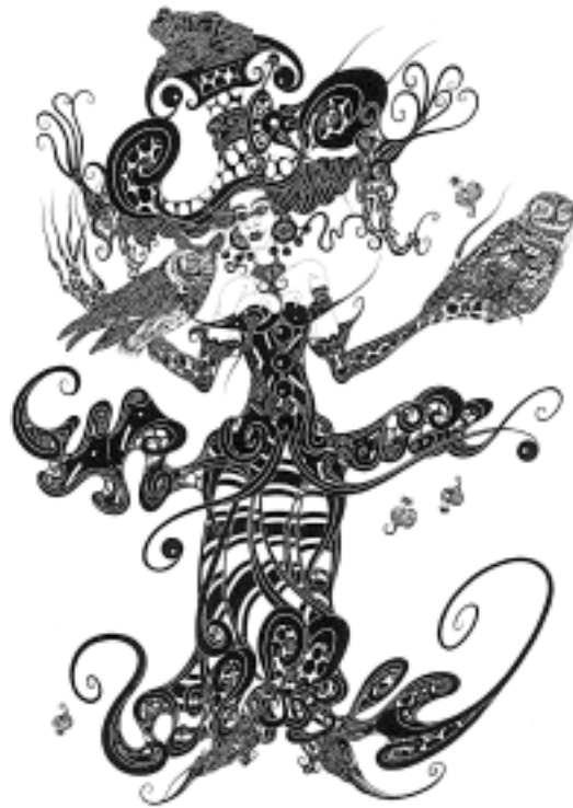
Németh Miklós: Baglyos szarkaszká, a ZALA'ART 2000 című kiadványból

Igen. Löki az ingát. Letelt az időnk, haza kell menni. Különb is, hideg van. Moszkvában. Különb is: tele vagyok szerelemmel... És takonnyal – teszem hozzá azonnal, hogy ez az egész mégse legyen olyan átkozottul lírai.