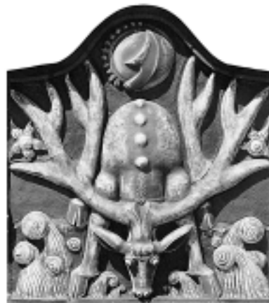
Németh János: Csodaszarvas, a ZALA'ART 2000 című kiadványból