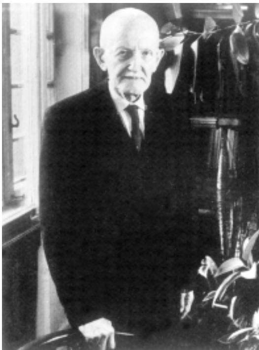
A múlt magyar tudósai sorozatban 1995-ban jelent meg Benkő Loránd tanulmánya Pais Dezsőről, a felvétel a kötetből való

Lator L.: Igazad van, ez a helyes kifejezés. Kodály is úr volt. Amikor be-bejött azokra a kollégiumi kabarékra vagy gólyavizsgákra, és utánozhatatlan maliciával ordított rá az amúgy is halálra rémült gólyára, akkor is csak Kodály úr volt. Két olyan tanárra emlékszem a