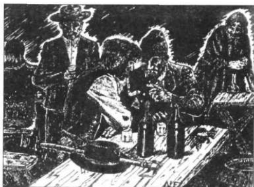
Gazdát cserél az arany (A szerző grafikája)