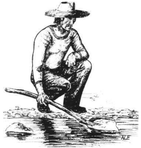
Aranyezés most - vaslapáttal

A Dráva és a Mura mellékén az aranyászok többsége legalább két, de inkább három nyelven beszélt: magyarul, horvátul és