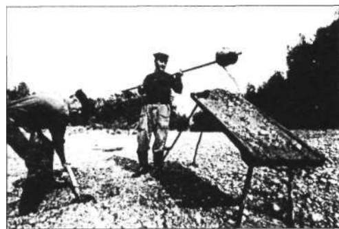
A munka legnehezebb része