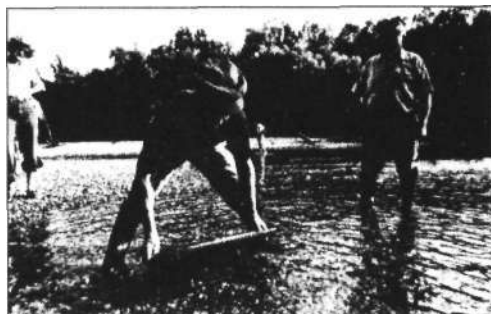
Ehhez nagy gyakorlat kell!