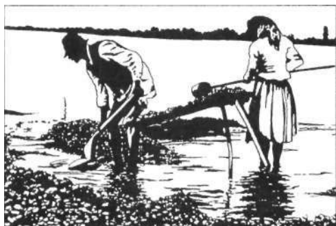
Aranymosás a Dráván (A szerző grafikája)

németül, s ez nem is csoda, hiszen Trianon előtt együtt éltek, együtt dolgoztak és ami szintén nem mellékes -, együtt is mulattak. Nagy közös mulatozásokra került sor például Nagykanizsán, miután ott beváltották az aranyukat. Ilyenkor nemzetközi aranyásztársaság ült körül egy-egy hosszú asztalt, s felváltva énekeltek kivilágos virradatig a szebbnél szebb magyar, horvát és vend nótákat. Minél jobb volt a cigány, minél több borocska csúszott le a szomjas aranyásztorkokon, annál pajzánabbak lettek a nóták. Az egyik így kezdődött: