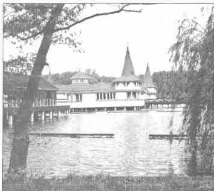
A tőzegfenekű tó

"... A múlt nyáron az iszapfürdőben volt, a fogságban szerzett csúza miatt. A meleg víz tavában figyelte meg, hogy mi a társaság... Azon a helyen, ahol a forrás felfakad, s ahol a nép szája szerint feneketlen a tó, tehát