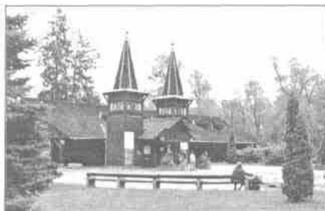
A tófürdő bejárata

1944 márciusában a németek megszállták az országot. Hévíz szállodáit hadikórháznak rendezték be. Az élet egyre komorabbá vált, majd 1945 március 28-án áthaladt Ukrán Front, amit ezután 45 év szovjet megszállás követett. Hévíz életében új fejezet kezdődött.