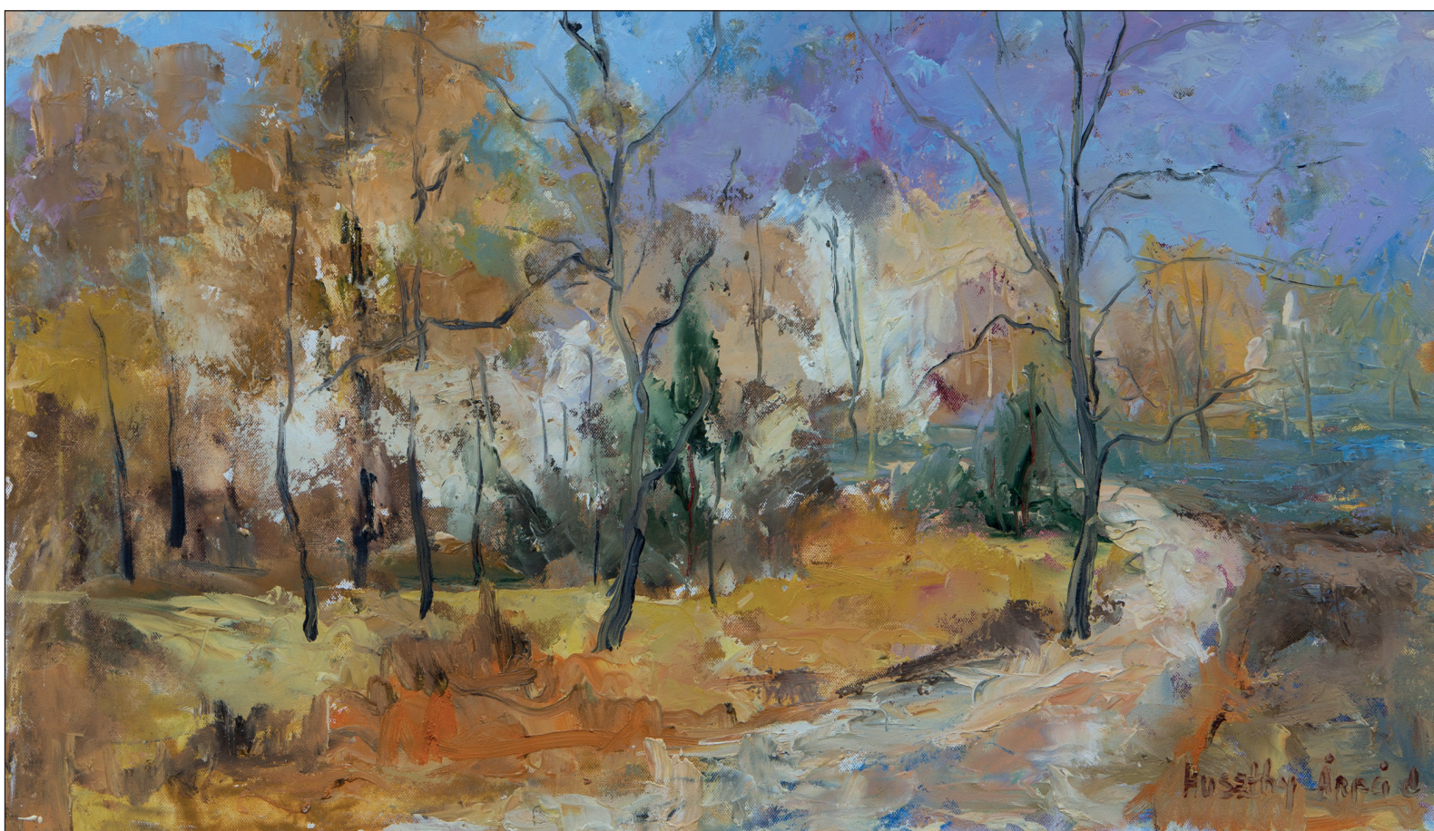
Huszthy Árpád Közeleg az ősz (60x80 cm, olaj, vászon, é. n.)

„...s az rendkívüli dolog, hogy Sántha Antal (1952) egy személyben vállalta a város festészettörténetének összegzését, és egy olyan gyűjtemény összeállításának terheit, amely ma már a hajdúváros majd minden alkotójától tartalmaz munkákat, és a helyi értékek felkutatása közben megismert alkotók életébe enged betekintést ez a kiadvány.” (Áfra János-Tarcsy Péter: A hajdúböszörményi festészet rövid története )