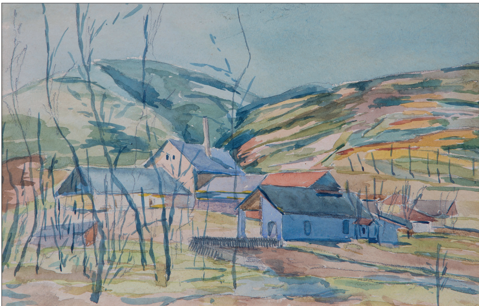
Boromisza Tibor Tájkép (30x38 cm, akvarell, papír, 1920-/30-as évek)

„...s az rendkívüli dolog, hogy Sántha Antal (1952) egy személyben vállalta a város festészettörténetének összegzését, és egy olyan gyűjtemény összeállításának terheit, amely ma már a hajdúváros majd minden alkotójától tartalmaz munkákat, és a helyi értékek felkutatása közben megismert alkotók életébe enged betekintést ez a kiadvány.” (Áfra János-Tarcsy Péter: A hajdúböszörményi festészet rövid története )