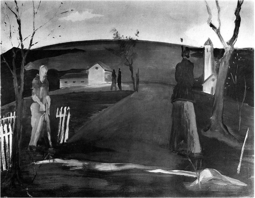
Farkas István: Este (Alkony, Soir) , 1931, tempera, fa, 144 x 145 cm, Janus Pannonius Múzeum, Pécs, ltsz.: 68. 494. Repr. André Salmon: Etienne Farkas . Paris, 1935. 10. © Janus Pannonius Múzeum, Pécs

és színezésük, továbbá a köréjük festett színek, a víz, az ég, a fű színe együttvéve kelti a nézőben azt az érzést, hogy ezeken a képeken a pusztai felületábrázolásnál több és egyéb van, s hogy festőjükben gondolkodó és a lét fájdalmas problémaival együttérző ember él. Képein mindez nincsen szóval megfogható módon elmondva. A megindított képzelet megkötetlenül keresheti rajtok a rejtett értelmet és a ki nem mondott szándékot. Milyen rejtelmes festmény például az Elvégeztetett című. Valami asztalféle fekete alkotmányra, amely azonban Szent Mihály lova is lehet, rákönyököl egy asszony. A gyászoló közönségre emlékeztető mozdulattal áll az asztal körül egy férfi, meg két nő. Vibráló sárgás fénysugár vetődik a lehajló asszony és a három alakos csoport közé, alul pedig, a földön fantasztikus zöld fények játszanak. Mi történik ezen a képen? Nehéz eldönteni. Csak egy bizonyos: hogy aki jól megnézte, az valami megdöbbenést, valami szívészorítót érez, valami olyat, ami a tragikum őrzéséhez hasonló. Különös emberi alakok Farkas István képeinek szereplői. Egyhelyben állók, vagy ülők, egy bizonyos mozdulatban megrögzültek, részvétlenek, vagy fásultak, az élet elfáradottjai: szomorú emberek. Keszthelyi emlék egyik képe a címe, s háttérben a Balaton vize látszik. Az idő ősz eleje, a fák lombja rozsdaszínű. Elöl egy szikár öregasszony áll fekete kalappal és galléros fekete köpenyben. Arcából csak a