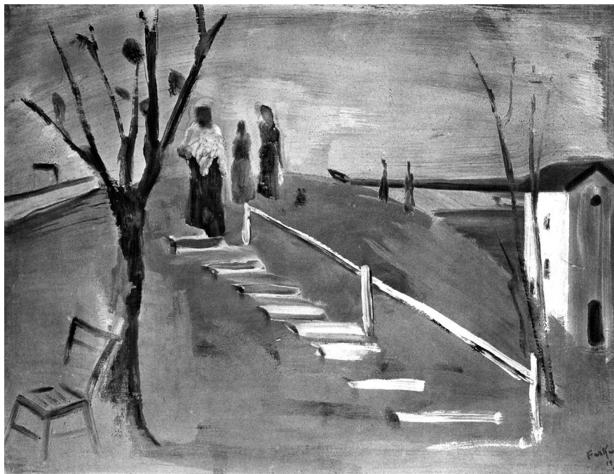
Farkas István: A dombon, 1931, tempera, fa, 65 x 81 cm, SZM – MNG, ltsz. 8609 © Szépművészeti Múzeum – Magyar Nemzeti Galéria, Budapest

mit fest. Farkas István nagy dologra vállalkozik. Nem a láthatót akarja kifejezni nekünk. Célkitűzése újnak tűnik, holott gondoljunk csak a középkorra, amikor láthatatlan emberi álmokat valósítottak meg művészek képzőművészeti alkotásokon. [...]