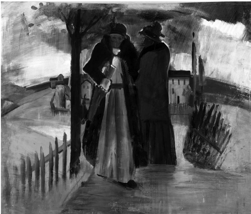
Farkas István: Vihar után, 1934. Tempera, fa, 115 x 136 cm