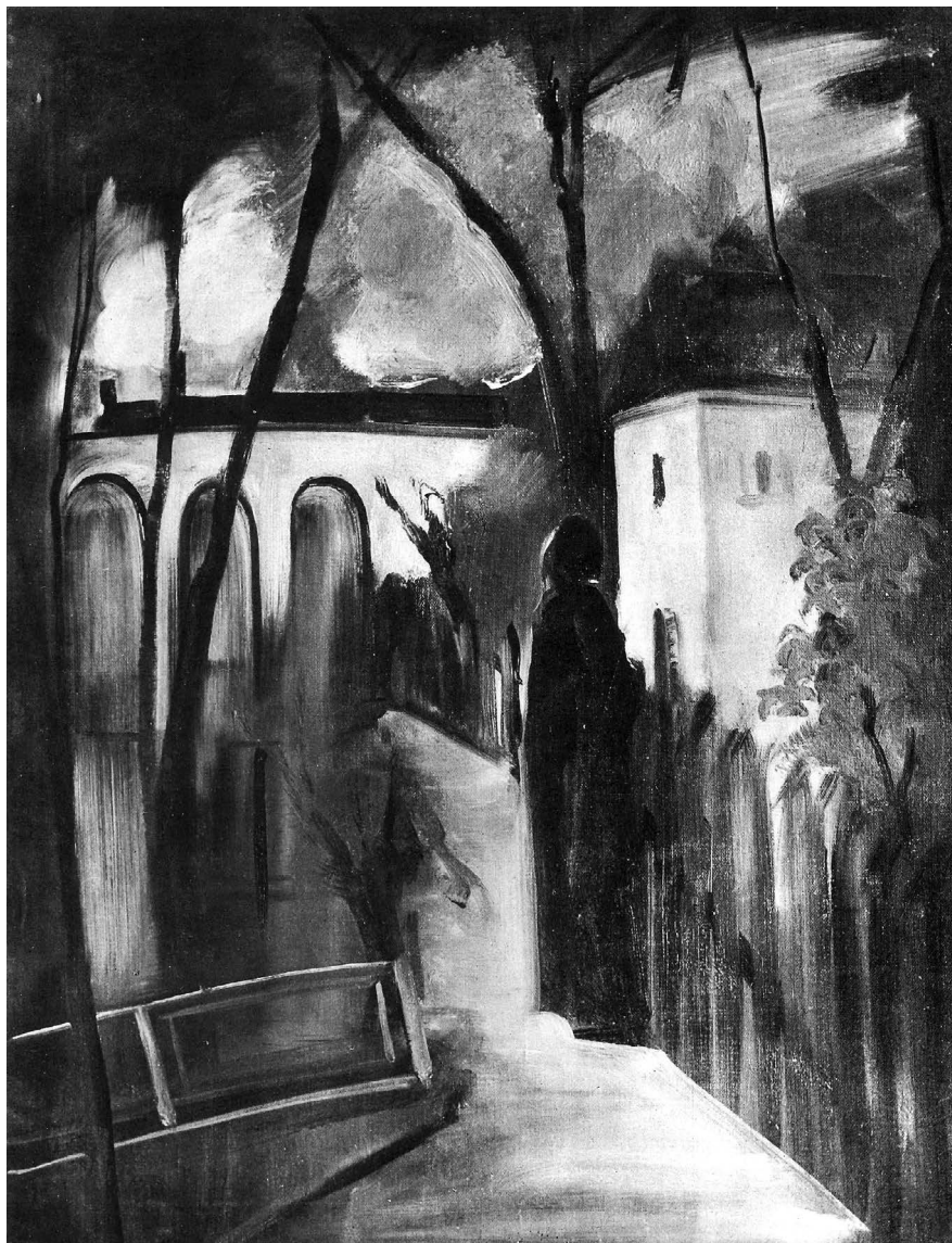
Farkas István: Nogent-sur-Marne-i emlék, 1930. Tempera, fa. Lappang. Repr. André Salmon: Etienne Farkas . Paris, 1935. 11.

csontszerkezetet jelzi néhány ecsethúzás mintha halálfej ülne a kalap alatt. A Vihar után régebbi munkája a művésznek, Párizs után rendezett első gyűjteményes kiállításáról való és stílusának újabb változataitól derűsebb színei különböztetik meg. Üdén zöld mezőn gyalogösvények keresztezésében két idős nő sűrű foltja áll. A rét zöldje nem a valóságra emlékeztet, hanem inkább valami azon túlvalóra.