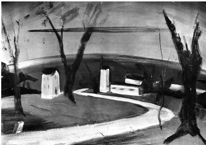
Farkas István: Lakatlan város , 1931. Tempera, fa, 46 x 65 cm, Türr István Múzeum, Baja, ltsz.: 69.103. Repr. André Salmon: Etienne Farkas . Paris, 1935. 9.