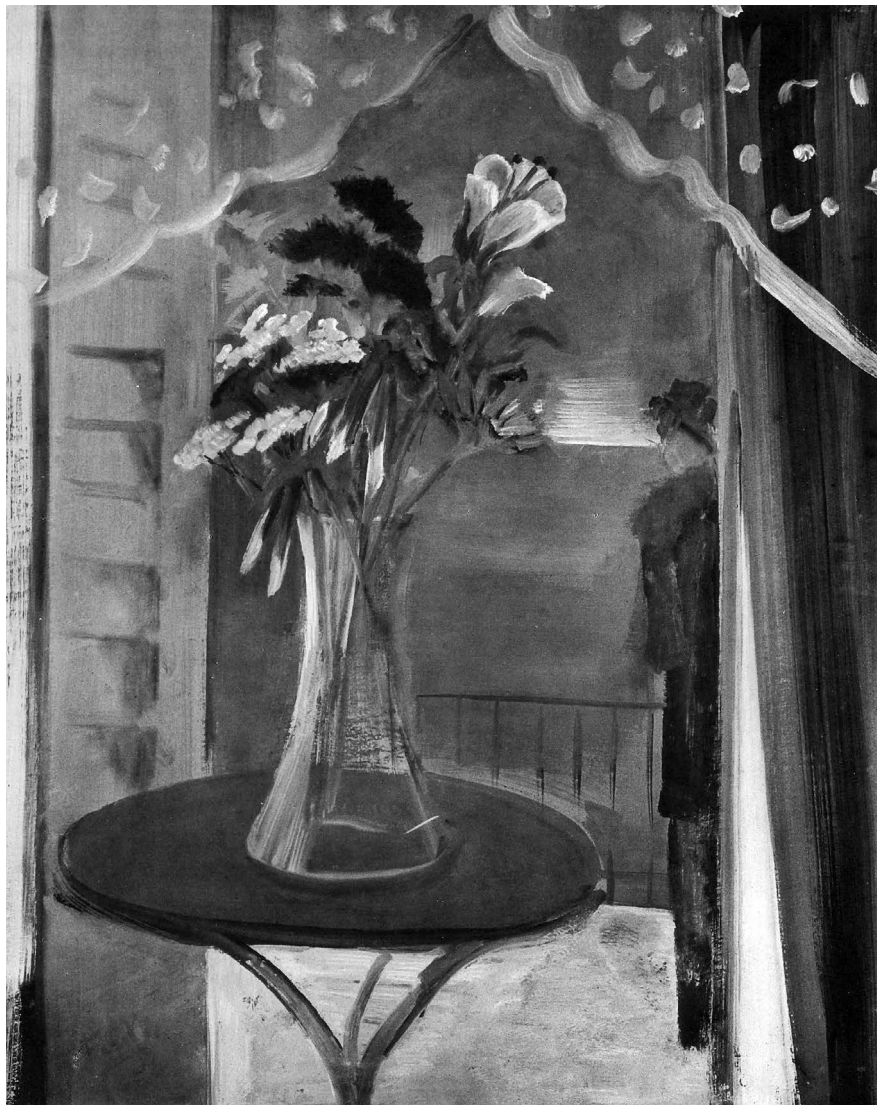
Farkas István: Virágok, 1934. tempera, fa, 100 x 80 cm. Mgt. Repr. André Salmon: Etienne Farkas . Paris, 1935. 5. Egykor Fruchter Lajos gyűjteményében, Budapest

művészt. Erre rácsfolna az a néhány akvarell-tanulmány, amely vízparti motívumok, gyümölcs s más efféle tárgy, aztán rajzolt aktok sorozatából áll. És kompozíciói is. Érezzük, hogy ilyesfélét valóban látott is a művész, csakhogy itt mindez tömörítve, egy lírai erőttől alakítva, mint szilárd egység kerül elénk. Ez az egység – a jó kép fontos tartozéka – ennél a művésznél körülményesség nélkül áll elő, úgy hat, mintha magától adódott volna. Ami bizony nem mindennapi sajátság. Fokozza ezt az