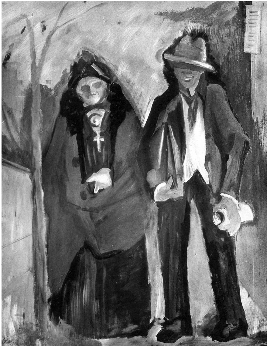
Farkas István: Fiatal részeg költő anyjával , 1932, tempera, fa, 145 x 115 cm, KKJM, ltsz.: 84.90. Repr. André Salmon: Etienne Farkas . Paris, 1935. 15.