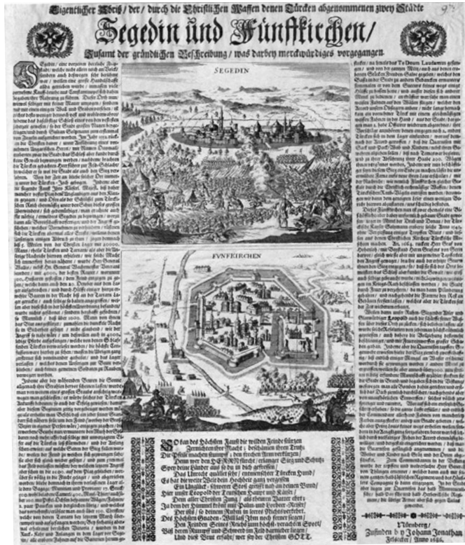
T 782b.

A krónikába nem került be bécsi kiadású röplap, de éppen ez a kettős metszetű nürnbergi kiadvány sok egyezést mutat Johann Martin Lerch bécsi nyomtatványával. A Felseckerek gondosan kiépített bécsi kapcsolatait mutatja, hogy az 1670-es évektől jelentős szerepet vállaltak a Habsburg dinasztikus reprezentációban. Gockel 1682-ben Leonhard Loschge 1675 és 1700 között működő nürnbergi kiadó és kereskedő török háború közeledtét hirdető röplapját illesztette a kéziratába. 46 Loschge 1683-ban tizennégy féle röplapot adott ki a török háborúról.