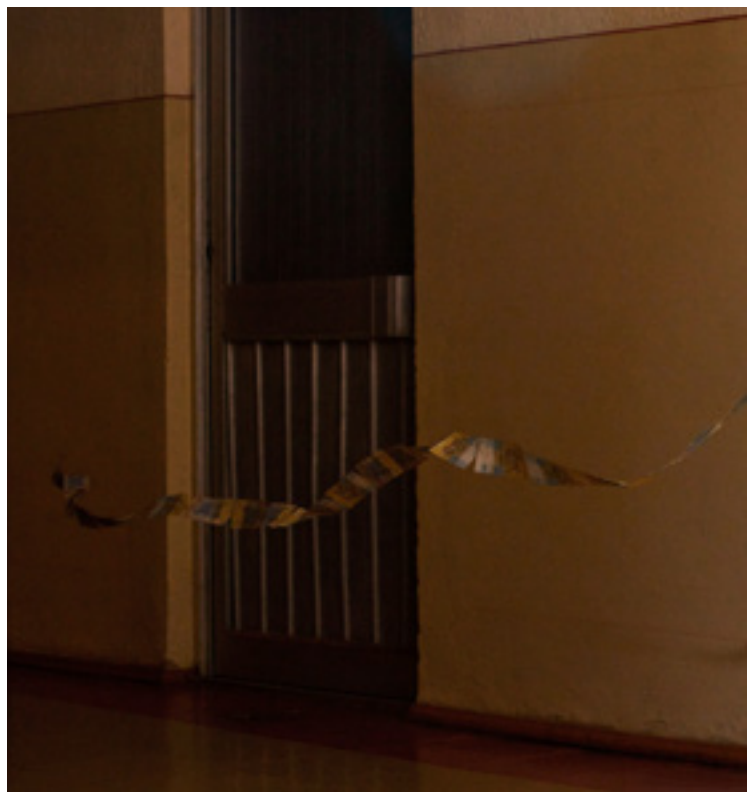
Ternopil (Nyugat-Ukrajna) egyik árvaházában pénzzel játszanak a gyerekek

Bár a mélyszegénység erősen rányomja a bélyegét az általános közérzetre, Rácsok Balázs számtalan olyan emberrel találkozott, aki a nincstelenség legmélyebb bugyrában is megélte a boldogságot. „Csodálatos példákat látunk arra, hogy a szegénységben élő emberek körében sokszor mennyire másként jelenik meg a szeretet, az összefogás vagy éppen az adakozás kérdése. Egy nap az egyik családok átmeneti otthonába érkezett egy háromgyermekes édesanya, akinek szó szerint el