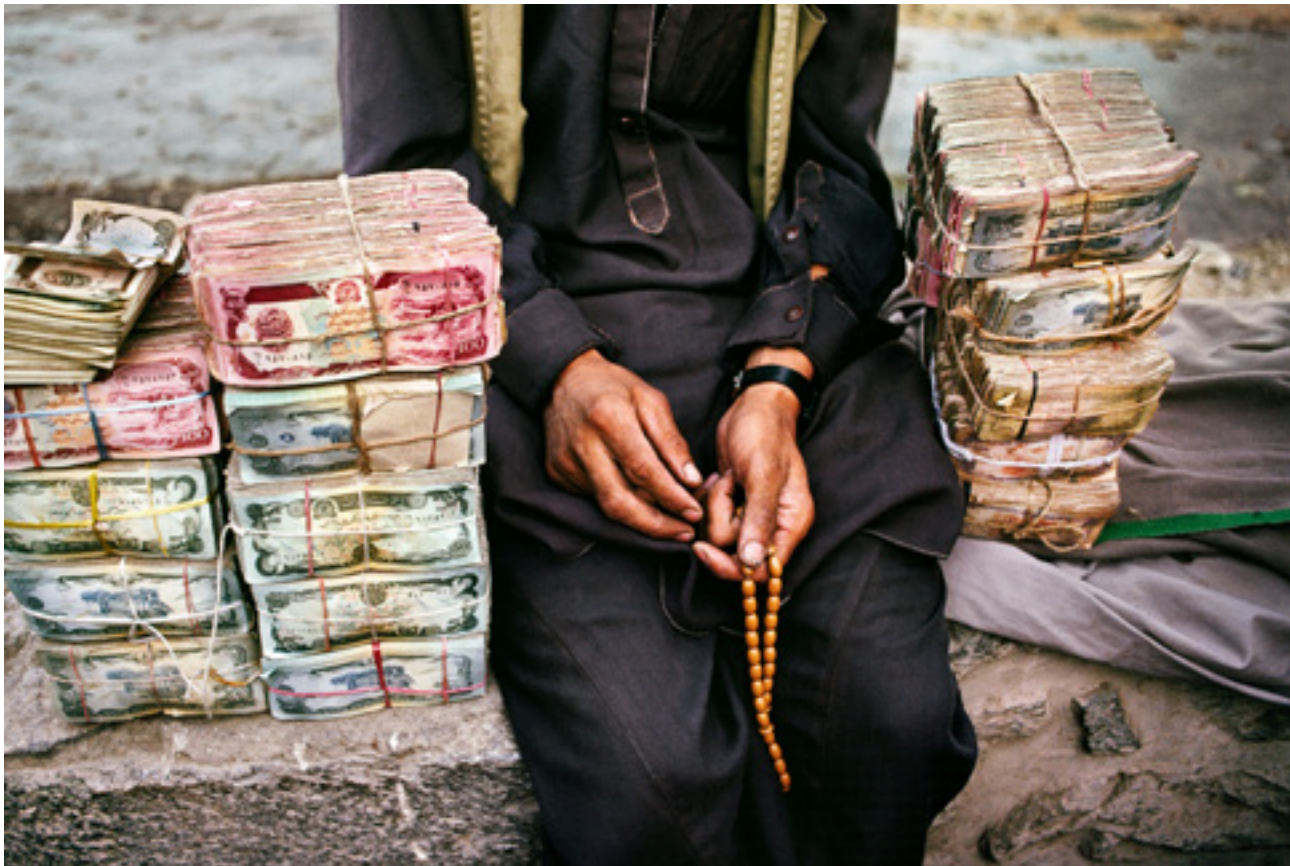
Infláció Afganisztánban. Kabul, 1992

Az amerikai Purdue Egyetem tanulmányából az olvasható ki, hogy évi 15-20 millió forintnak megfelelő keresetre lenne szükségük az embereknek ahhoz, hogy boldogan éljenek.