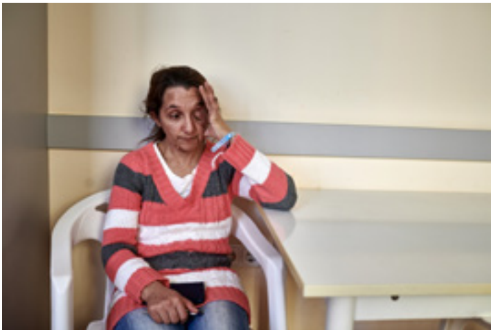
A Semmelweis Egyetem Mária utcai Szemészeti Klinikáján, az első műtétet megelőző napon