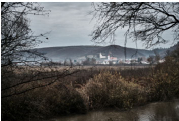
Szendrőlád látképe a Bódva felől