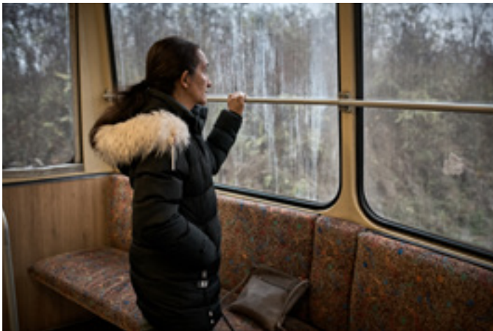
Budapestig közel négy óra az út tömegközlekedéssel Szendrőládról