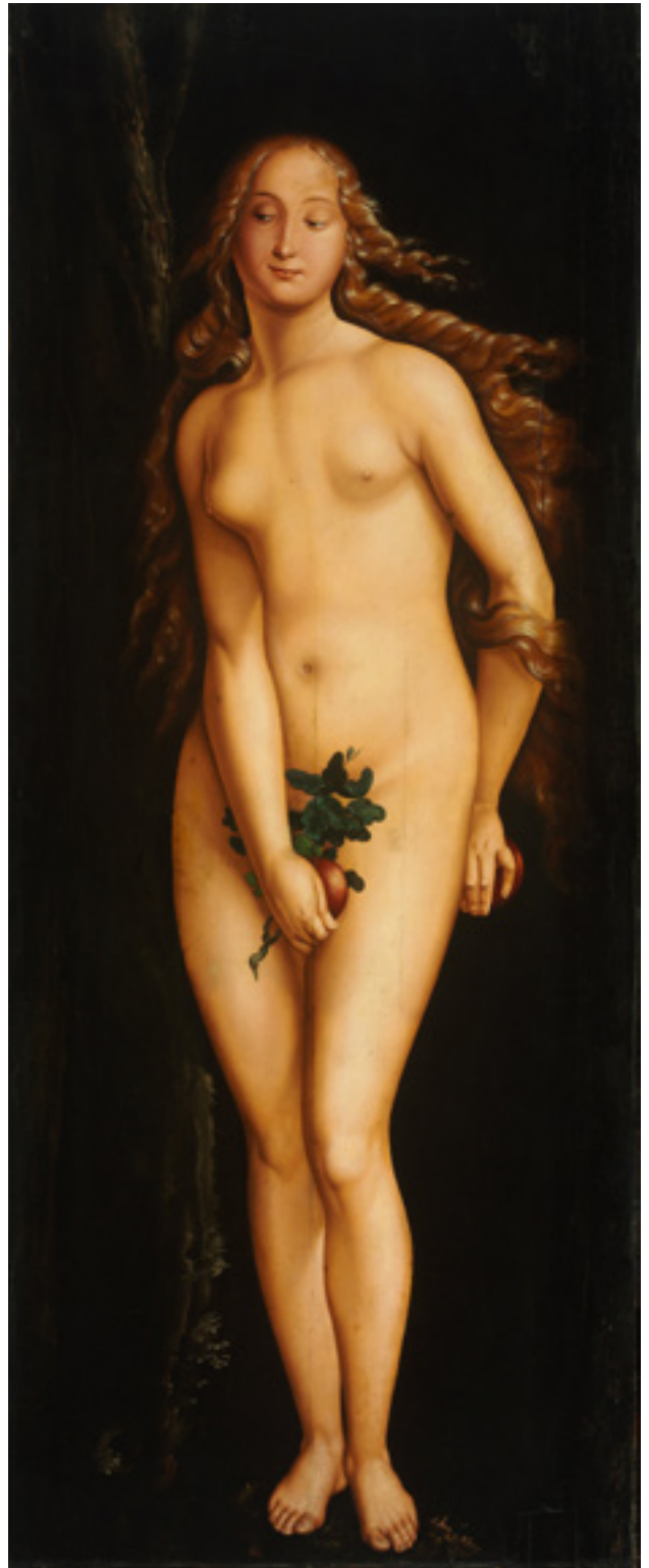
Hans Baldung Grien (1484–1545): Éva. Olaj, hársfa, 208,5×83,5 cm, 1525; a Szépművészeti Múzeum gyűjteményében