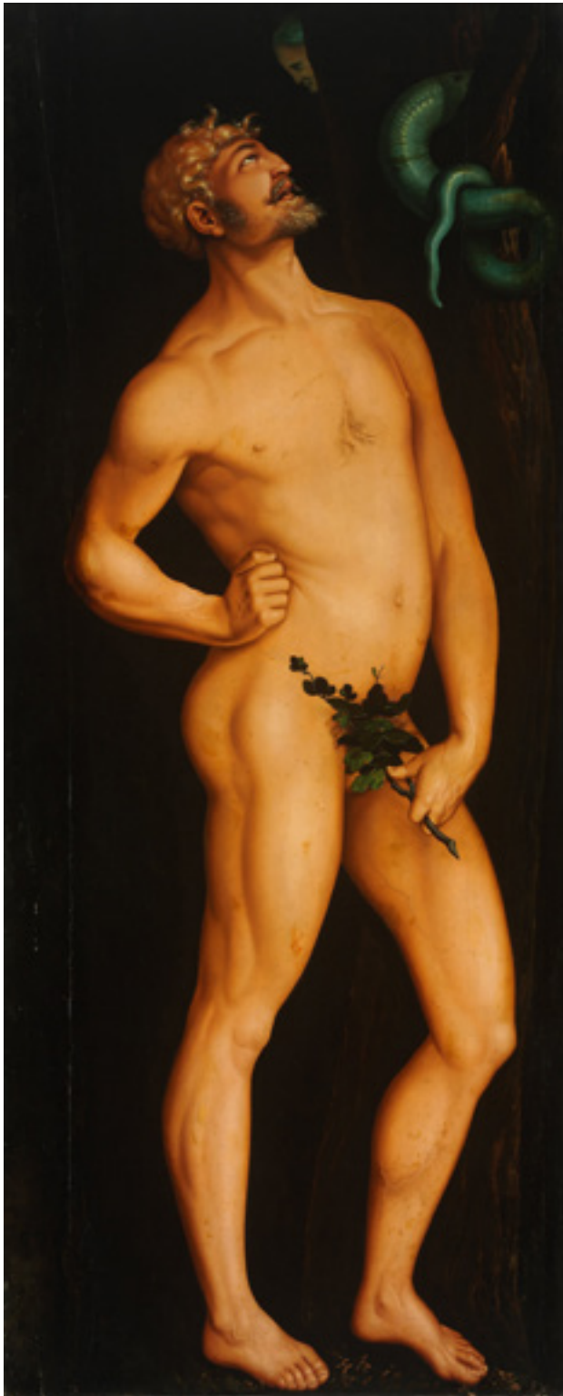
Hans Baldung Grien (1484–1545): Ádám. Olaj, hársfa, 208,5×83,5 cm, 1525; a Szépművészeti Múzeum gyűjteményében