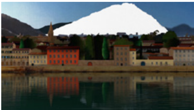
Kondor Attila, film still a Belső könyvtár c. animációs filmből, 2018