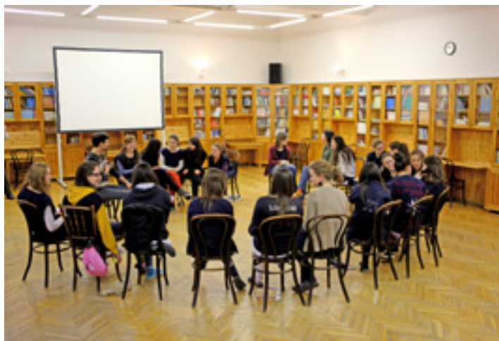
Patronás lányok csoportfoglalkozáson

– Komoly egyensúlyozást igényel, de a munkaerőpiac olyan mértékben az együttműködés felé tolódott, hogy ez néha fontosabb a tantárgyi tudásnál. Én sok olyan gyerek kudarcának voltam tanúja, aki nagyon jó tanuló volt,