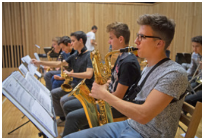
A pannonhalmi élet nemcsak az iskolapadban zajlik

– Pannonhalmán megtanuljuk, milyen nem otthon lenni vagy otthon vendégnek lenni. Ennek is megvan a művészete. Sokszor egy kamasz elmenekül otthonról, érthetően, de tapintatlanul és szeretetlenül. Nekünk felelősségünk van a kapcsolatainkért. Amikor a kis kilencedikesek először hazamennek, mindig elmondom