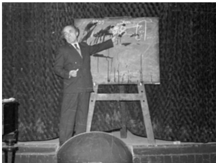
Öveges József professzor (1956)

1979-ben Öveges professzor távozott az élők sorából. Kívánsága szerint Zalaegerszegen temették, édesanyja sírja közelében. Még abban az évben megrendezték egykori tatai gimnáziumában az Öveges Fizikai Emlékversenyt, amelyből idővel hagyomány lett, iskolák vették fel a nevét, emléktáblák tisztelegnek előtte; Tatán, a vár alatt, az Öreg-tó és az Általér találkozásánál pedig köztéri szobra áll. A fizikustársadalom, a Magyar Fizikai Társulat azóta is tisztelettel adózik emléke előtt, hiszen,