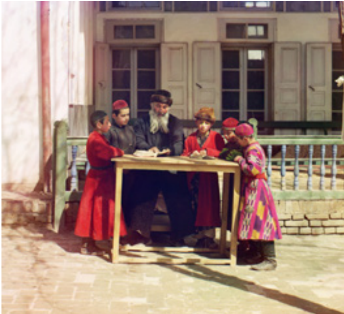
Zsidó gyerekek és tanítójuk. Szamarkand, Üzbegisztán, 1905–1915 körül