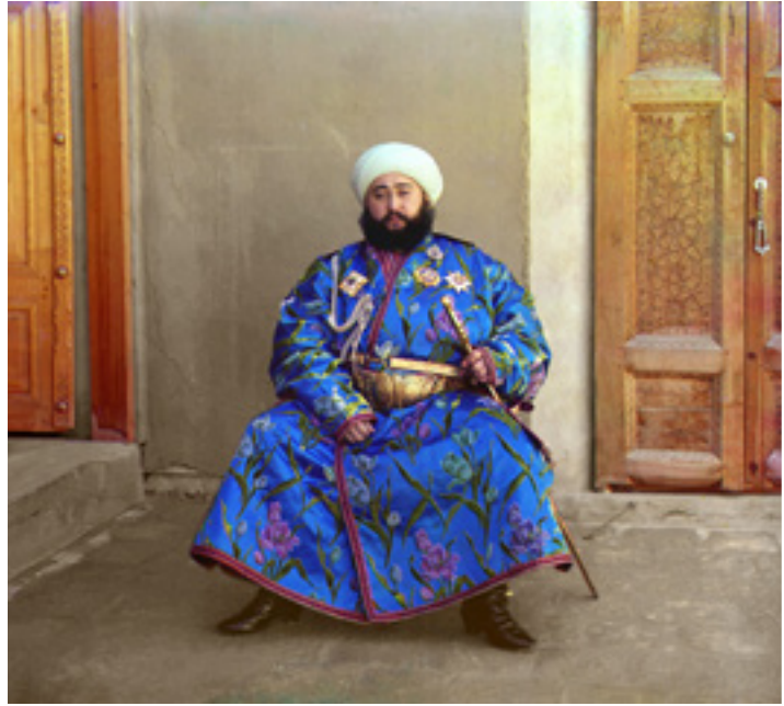
Mohammed Alim Kán. Buhara, Üzbegisztán, 1911