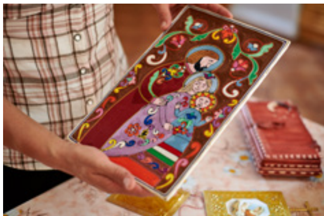
Elítéltek készítette ajándéktárgyak