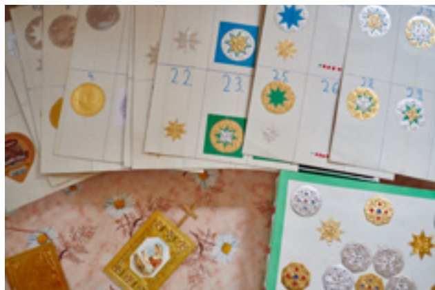
Az itt látható díszek konzervdobozokból, tubusokból és kupakokból készültek