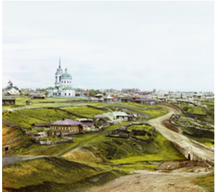
A Kolchedan falu látképe. Urál-hegység, Oroszország, 1912