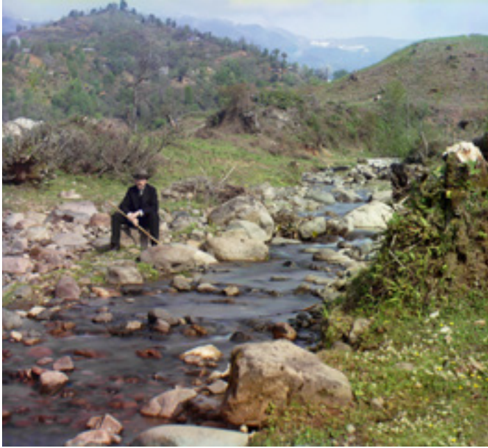
Őnarckép a Korolistkali-folyó partján. Georgia, 1912