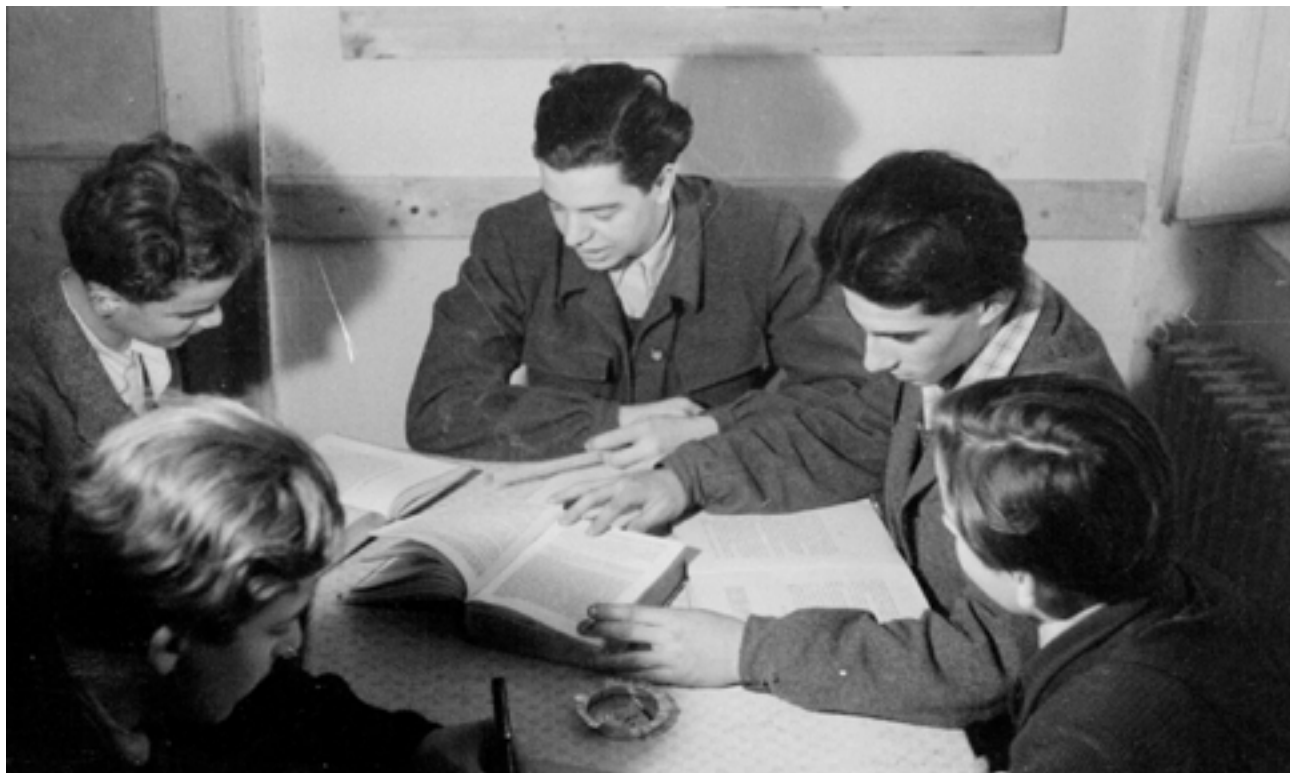
Tanulás a Sztehlo-gyermekotthonban (Gaudiopolis), 1946

a budavári, a kelenföldi és a kőbányai gyülekezetekben szolgált, de közben is rászorulókat, betegeket, időseket pártfogolt, gondoskodni próbált a kommunista kormányzat üldözöttjeiről, kitelepítettjeiről.