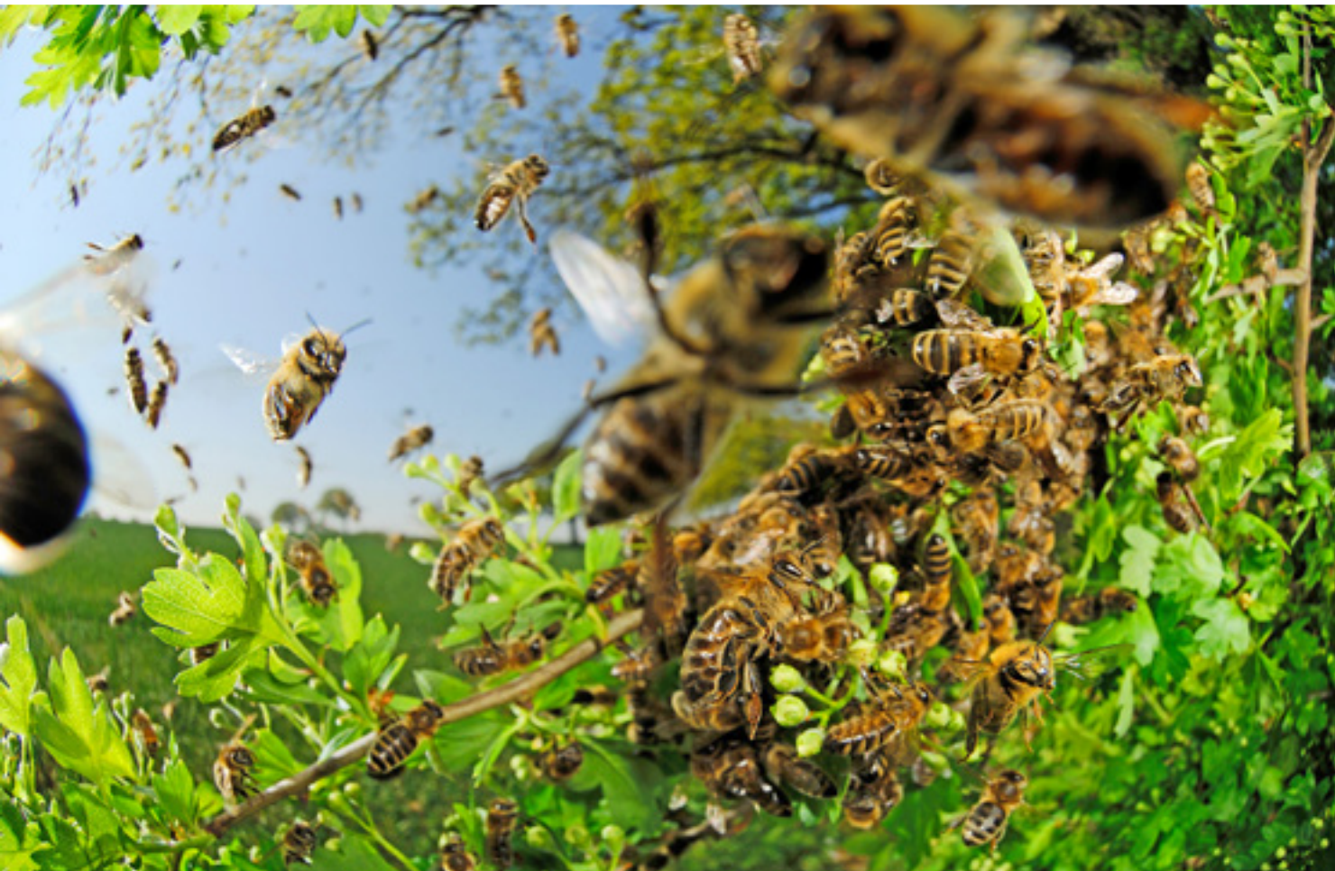
Háziméhek ( Apis mellifera ) rajzása