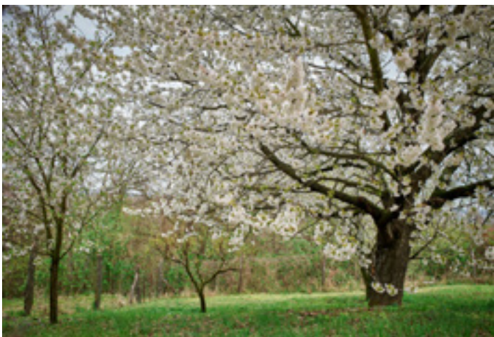
Gyümölcsös a Fekete-hegyen (Villánykövesd)

A MECSEK MEREDEK OLDALAIT INKÁBB A TEREPBRINGÁSOK ÉS A TÁJFUTÓK FOGJÁK SZERETNI, A VILLÁNYI-HEGYSÉG LANKÁI JOBBAN KEDVEZNEK A HOSSZÚ SÉTÁKNAK, LAZULÓS-FRÖCCSÖZŐS TEKERGÉSEKNEK, A DRÁVA ASZFALTOZOTT TÖLTÉSEIN PEDIG AZ ORSZÁGÚTI KERÉKPÁROZÁS MEGSZÁLLOTTJAI ÉLHETIK KI SEBESSÉGVÁGYUKAT.