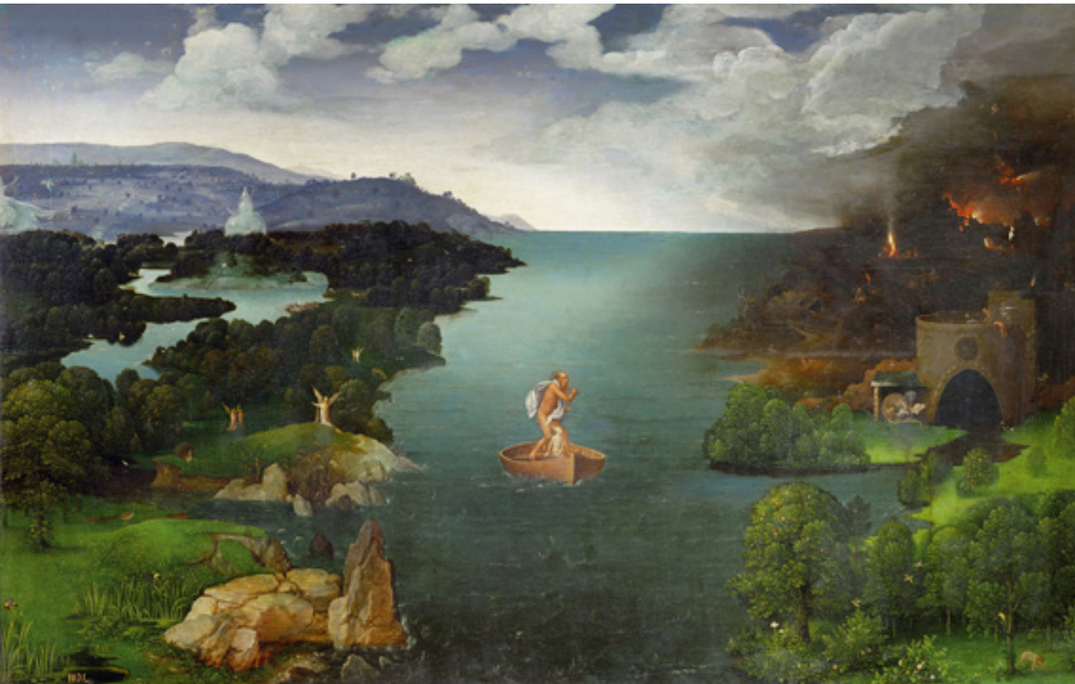
Joachim Patinir (1480 körül–1524): Átkelés a folyón. Olaj, fa, 64×103 cm, 1516 körül

Ennyi hiány, ennyi negatívum után mégiscsak feldereng valami, amit a költő tud: azt tudja, hogy a mennyország nem statikus valóság, hanem esemény lesz, röptetés, a tökéletes szabadság valósága. Igen, mert az ember számára a mennyország is, a pokol is térélmény lesz, ahogy Pilinszky pár évvel később, a „Terek” című költeményben vallja: