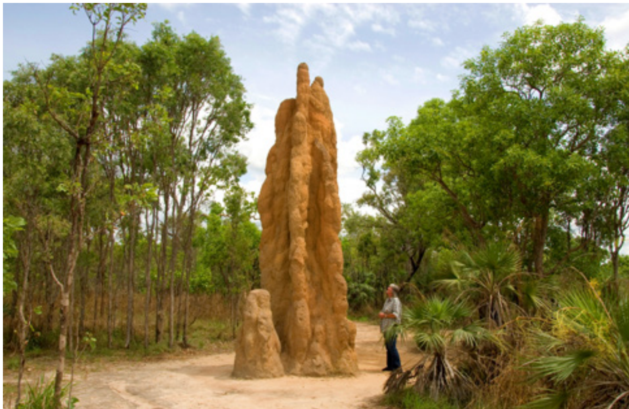
Termeszvár az észak-ausztráliai Litchfield Nemzeti Parkban