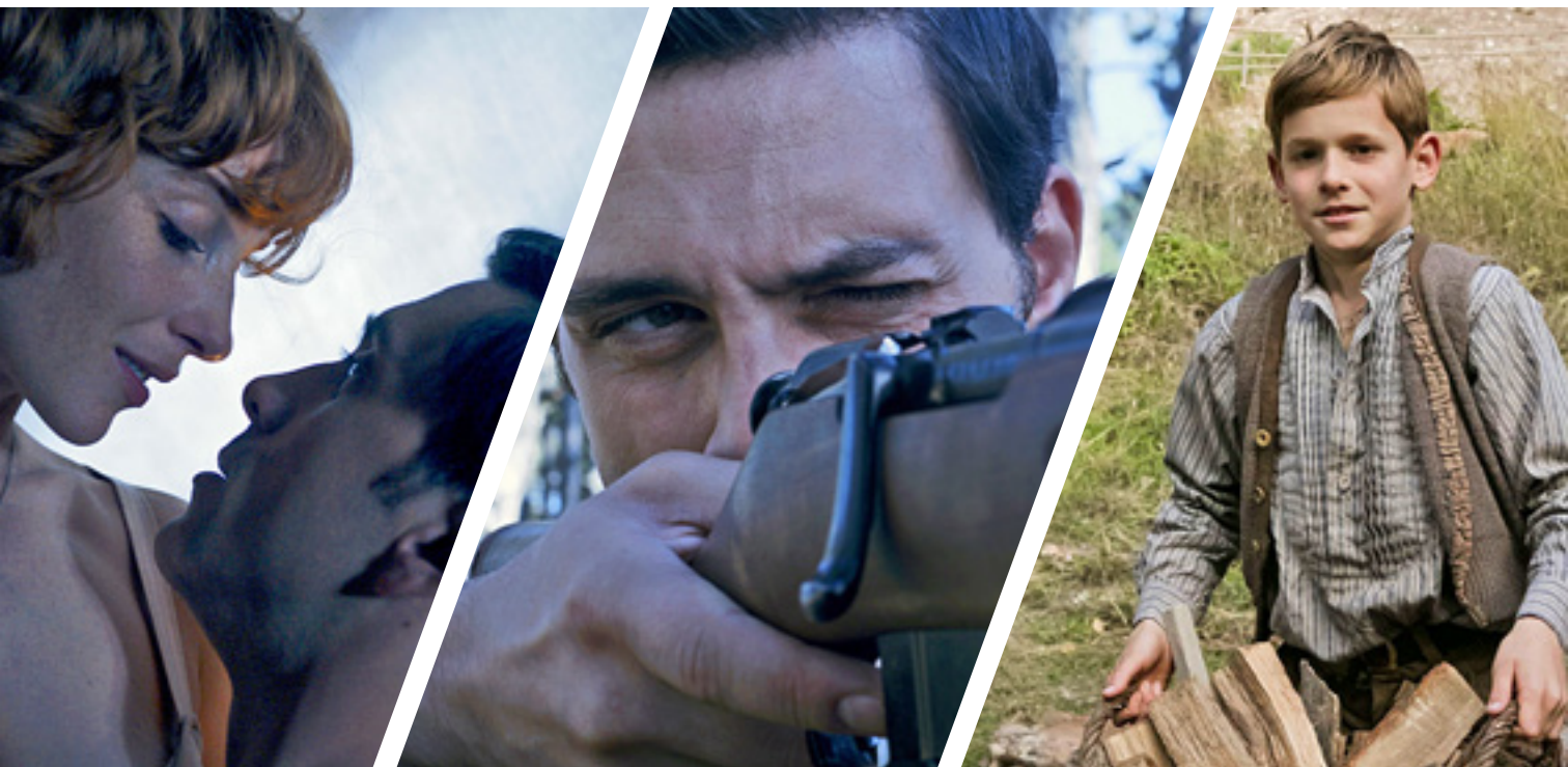
Jelenetek az Apró mesék című filmből

Amikor írtam, akkor épp az „Apró mesék” volt a kedvencem. Azt éreztem, ez az eddigi legfordulatosabb, legkímunkáltabb, legképszerűbb munkám. Aztán ki tudja. Majd az idő eldönti.