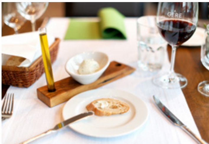
Mandula Étterem, Villány