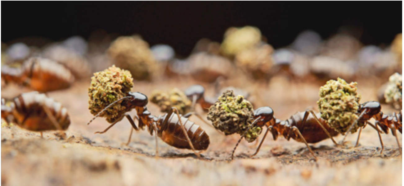
Termeszek ( Longipeditermes longipes ) leveleket szállítanak a kolóniába. Kubah Nemzeti Park, Borneo, Malajzia