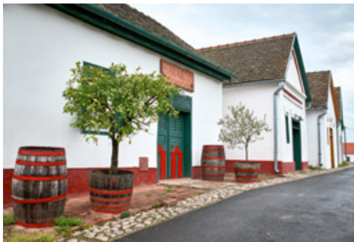
A palkonyai védett pincesor

Idén 5. alkalommal rendezik meg a Palkonyai Dűlőfutást, ami a kitűnő szervezésnek köszönhetően a régió egyik legfontosabb sportrendezvényévé vált. Az eseményt lelkes futókból álló csapat hozta létre, ötletüket pedig támogatta Palkonya önkormányzata, helyi borászok és a Vylyan Pincészet. A 9,9 és 19 kilométeres távok túrázva is teljesíthetőek, de a szervezők előre szólnak, hogy az sem lesz egyszerű menet. Idén 550 főben maximalizálták a futók létszámát, így érdemes időben regisztrálni ( www.dulofutas.hu ), ha versenyezni szeretnénk. Most pedig következzenek tematikus útvonalaink.