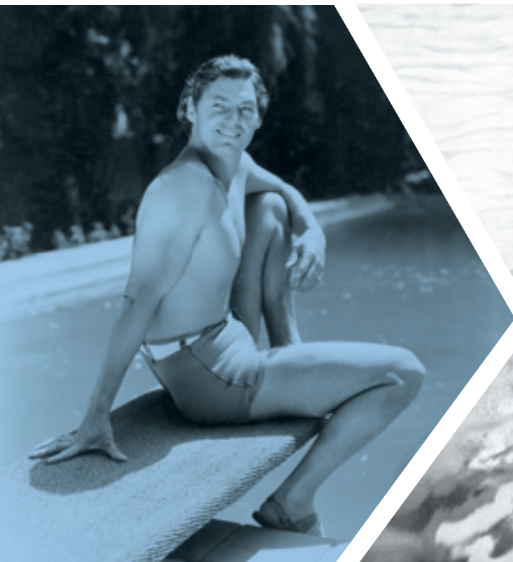
Johnny Weissmüller, 1930 körül