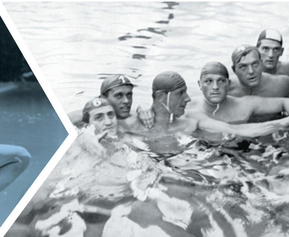
Az 1936-os berlini olimpián győztes magyar vízilabdások, a csapat tagja volt Halassy Olivér is.