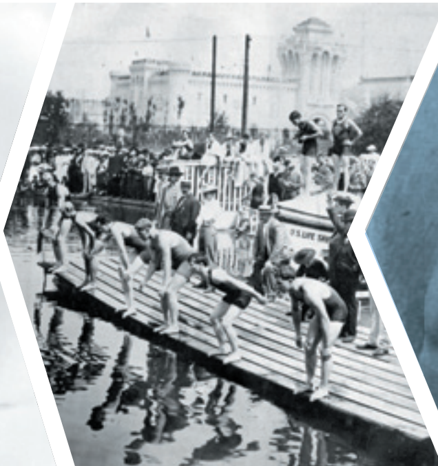
A 100yardos gyorsúszás döntője az 1904-es Saint Louis-i olimpián, amit Halmay Zoltán (baloldal, legszélen) nyert meg.