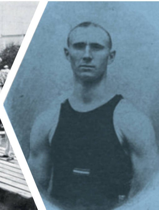
Halmay Zoltán (1881-1956), a „cápa” portréja