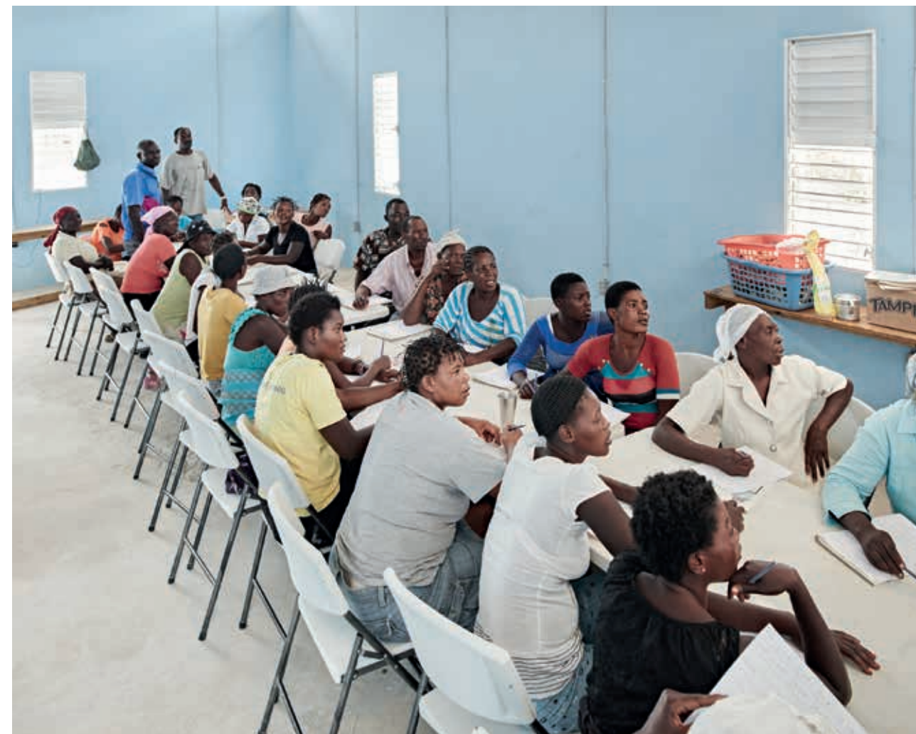
Édesanyák tanulnak írni egy délutáni foglalkozáson az Operation Blessing szervezet egyik iskolájában.

közbiztonság, ezért bekerített, fegyveres őrséggel védett lakónegyedben béreltem szobát. Ez havonta 600 dollárba került, a Hope Home-nál viszont csak 400 dollár volt a fizetésem, ezért kényszerhelyzetben voltam. Pultosként éjszaka dolgoztam heti 3-4 napot, 8-10 órás műszakokban, ez nagyon kimerítő volt.” Éjjelente motoros taxival járt haza, ilyenkor mindig egy ismerőse rendelt megbízható járművet. A karácsonyi-szilveszteri időszak volt a legsűrűbb: „Hajnali kettőkor végeztem a munkával, csak haza akartam jutni. Nem volt más választásom, minthogy egy motortaxira üljek. Megérkezett a motor, és elfelejtettem ellenőrizni, hogy az-e, akit hívtam. Elvitt egy sötét helyre, ami közel volt a bárhoz, de ott hárman vártak fegyverrel. Elkezdődött a dulakodás, ellopták a táskám, pont aznap kaptam fizetést. Sikerült elmenekülnöm, de az egyikük utolért, elkapott, és belelőtt a lábamba. Valószínűleg nem oda akart, de