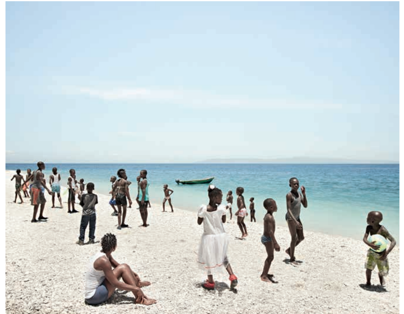
Osztálykiránduláson egy Port-au-Prince-től mintegy 60 kilométerre található tiszta tengerparton az Operation Blessing szervezet által működtetett iskola diákjaival.