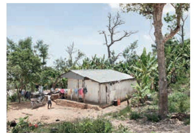
Vidéki ház egy Port-au-Prince környéki hegyvidéki faluban.