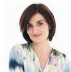
SZÁM KATI • BEKÖSZÖNTŐ