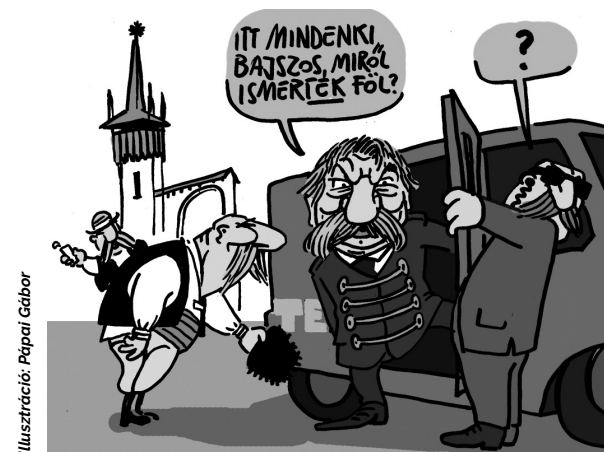
Illusztráció: Pápai Gábor