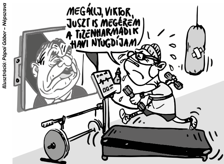
Illusztráció: Pápai Gábor – Népszava