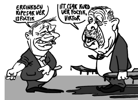
Illusztráció: Pápai Gábor – Népszava

Az Európai Unió valamennyi országa elítélte, hogy Törökország megtámadta Szíria kurdok lakta területeit. Ez a rengeteg civil áldozattal is járó háború egyedül a magyar kormány szerint szolgálja a nemzeti érdekeinket. Az Unió legmagasabb szintjeiről jelezték: döntenünk kell, Európát vagy a fél-diktatúrák világát választjuk.