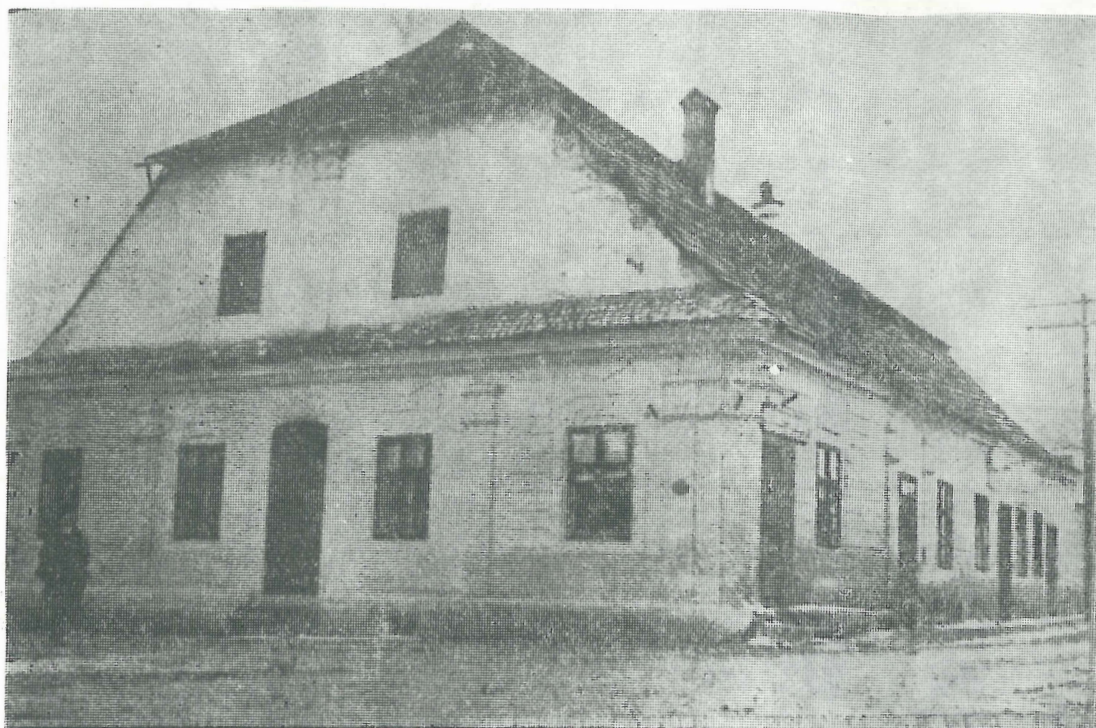
Casa Bálház (Casa Balurilor) din Sfântu Gheorghe, loc de întâlnire a muncitorilor.