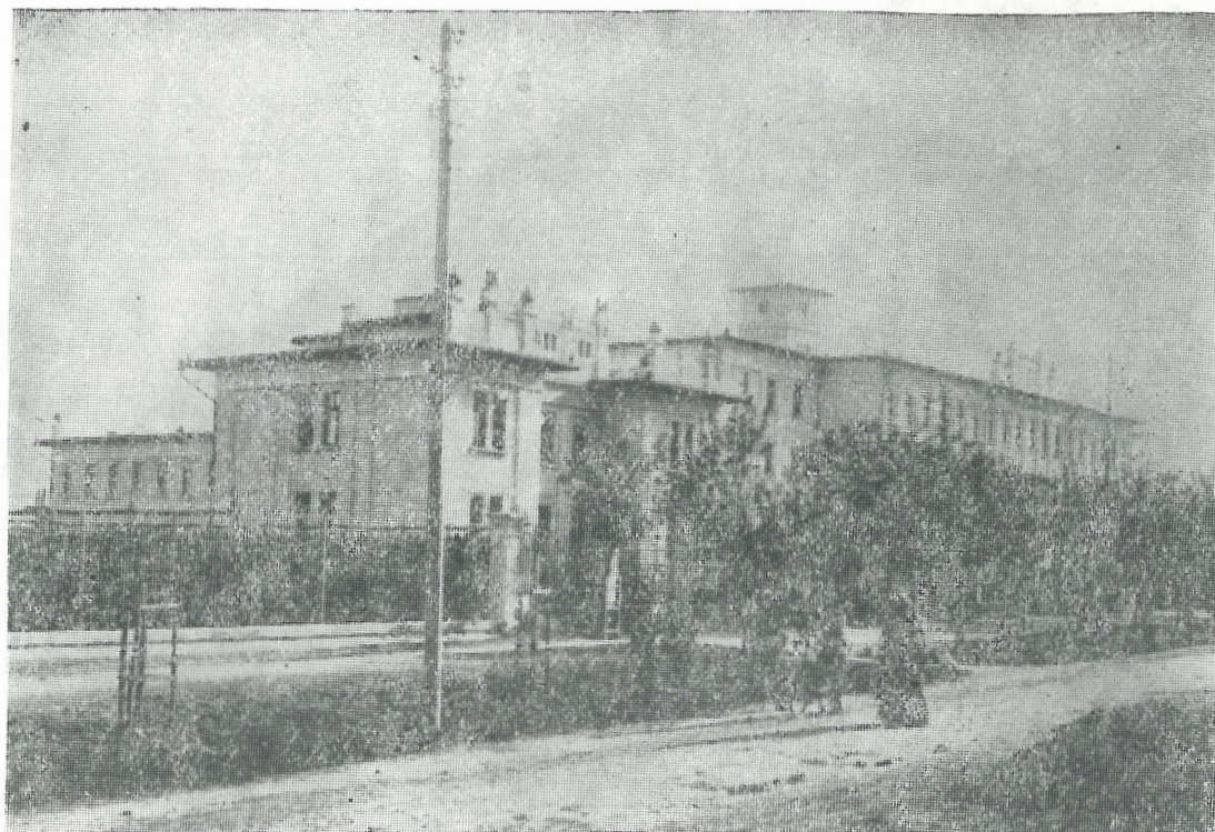
Fabrica de tutun din Sfintu Gheorghe în anul 1920.