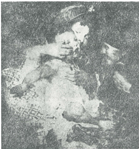
Az első fog