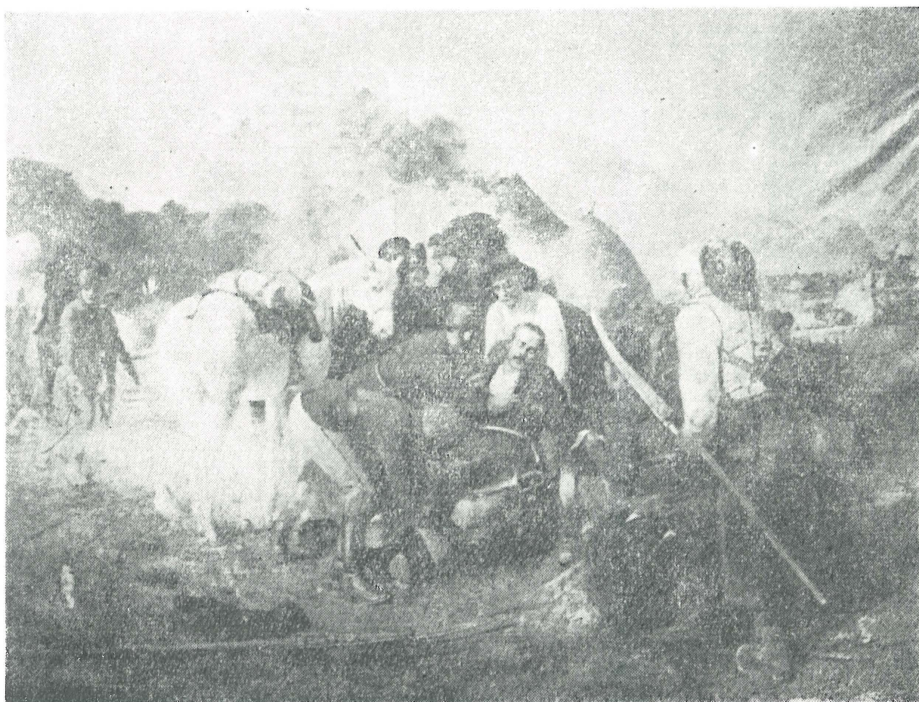
Gábor Aron halála