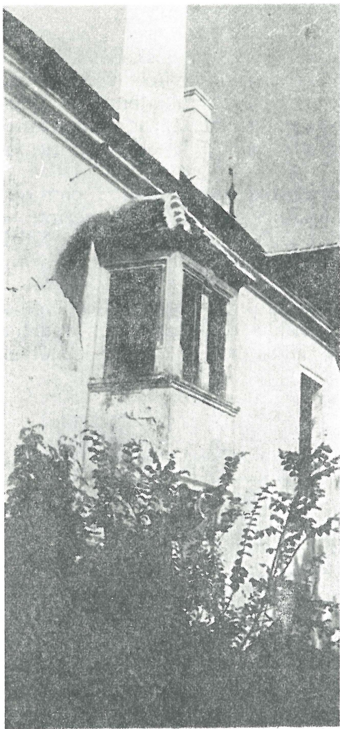
Reneszánsz erkély (Miklósvári kastély)

A jelenlegi látható épület téglalap alakú, egymenetes, emelet nélküli és nyugat-kelet irányú betájolású. Délnyugati és délkeleti szögletét támpillérekkel erősített bástyák szegélyezik. Déli oldalát keskeny gyümölcsös választja el a Falu patakának medrétől, míg az északit az udvar határolja. Előbbi oldala jellegzetes reneszánsz kastély képét nyújtja, míg az utóbbit klasszicista stílusban építették át a XIX. században. Az épület korábbi javítását jelezheti a keleti épületsarok tetőzeti bádogvitorlája, amelyen szoros egymásutánban a 178... számok olvashatók. Kár ugyan, de a negyedik — letörött szám — már úgyszem lényeges. Ötven év elteltével ismét javítják az épületet. Ezt az eseményt örökítették meg az egyik kéményen, amelyen az 1830 -as évszám olvasható 3 . A jelen század harmincas éveiben végzett tatarozást tetőzte be az 1974-ben végzett tetőjavítás, mint restauráló előmunkálat.