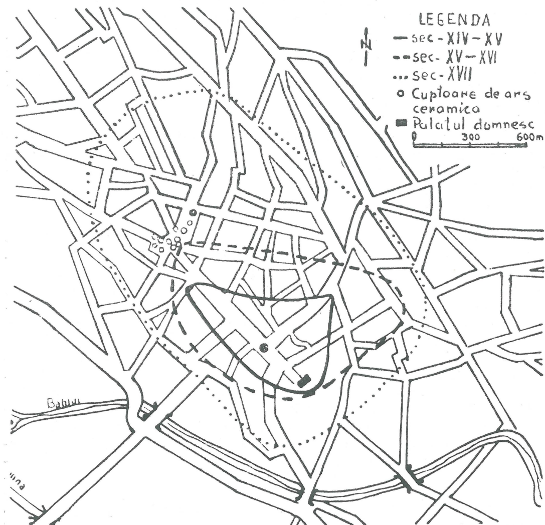
Fig. 2. Harta dezvoltării teritoriale a orașului Iași începînd cu secolul al XIV-lea.

După cum am văzut, descoperirile din acest nucleu inițial, atestînd o continuitate de locuire urbană începînd din secolul al XIV-lea, sînt în măsură să arunce o lumină nouă asupra dezvoltării forțelor de producție și a diviziunii sociale a muncii. Diversitatea construcțiilor și materialul arheologic scos la iveală constituie o dovadă indiscutabilă. Majoritatea obiectelor descoperite atestă prezența unor meșteșugari, precum