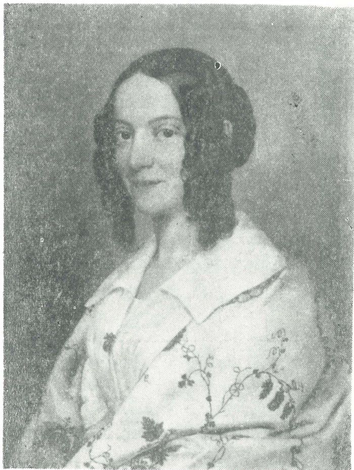
A művész felesége

den mosolygó női fej, bogárfekete szemekkel. Bontott hajfürtje némi hullámmal válláig ér. Kis kontyban zárul a háromnegyedes profil. Szembe néz. A háttér semleges, nem tagolt. Így az alak körvonala egységes, nyugodt, a profilból kissé visszafordulás nyomatékot kap. Nagyszerűen sikerült elfognia művésznöknek a lényegét, a formai lényegét a jellemző kifeje-