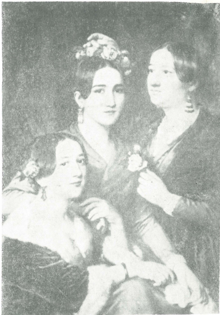
A három nővér

A múzeum volt második képe időrendben egyik Önarcképe (1837). Háromnegyed profilban tekint a szemlélő felé. Jóformán a fej dominál,