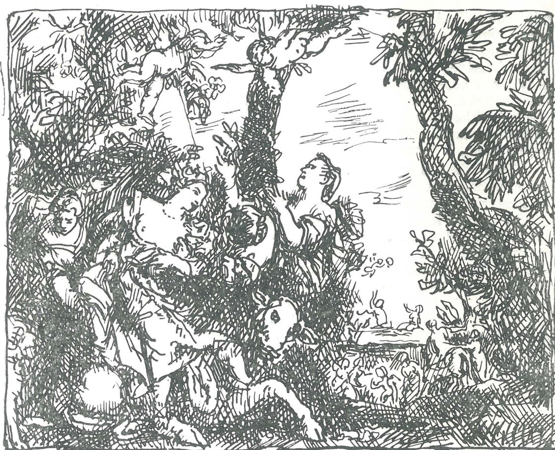
Veronese : Európa elrablása (Varga Nándor Lajos tollrajz vázlata)

segédkezett közben. S ha érezzük is az angol mester finom szürkéit az ég domborulatán, a hazai levegő átüt a felhők mögül és magányosságot sugároz az előtér egyszerű motívuma. Nyugodtan mondhatjuk e kútgémes tájról, hogy az első magyar meglátású magyar művész tájképe.