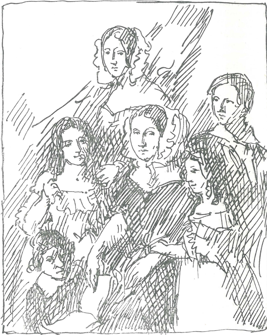
Bencsikné családjával (Varga Nándor Lajos tollrajz vázlata)

Olaszországból visszatérte után, a következő évben 1836-ban festi meg a „Három nővér“ c. képét. Benne a leggyengébb oldalát, a komponálást a legjobban mutatja be, jobban, mint későbbi csoportképein. Gondolok itt elsősül Bencsikné családjára (1840) és a művész „három leánykája“ (1849) csoportképére.