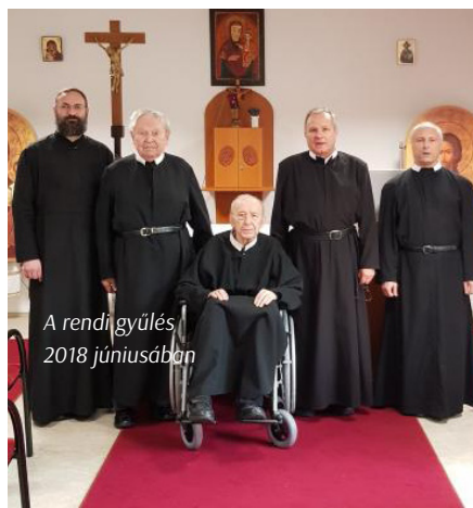
A rendi gyűlés 2018 júniusában