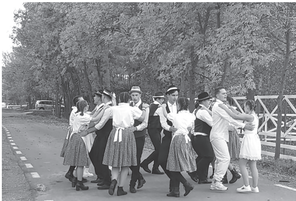
Több helyen megálltak a fiatalok és bemutatták a tanult táncokat a nézelődők örömeire