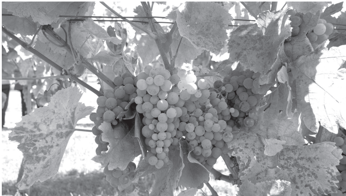
A tudószerű szőlőszemek teszik bakator fürtöket különlegessé más szőlőkhöz képest

Pálfi Noémi borszakértő az érmelléki borászat újjászületéséről, távlati kilátásairól