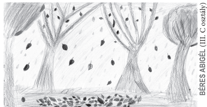
BÉRES ABIGÉL (III. C osztály)