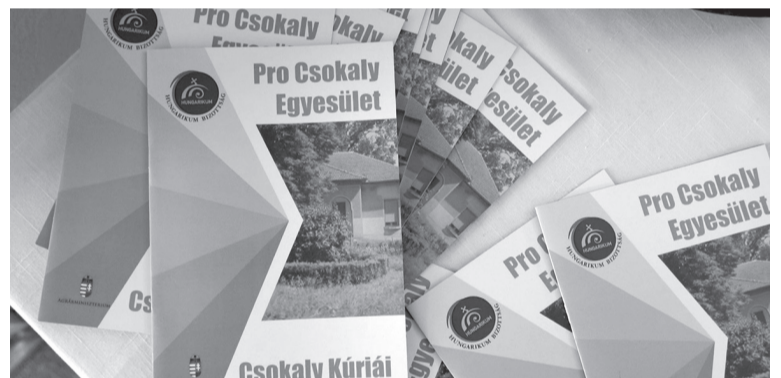
Az épületek történetéről olvashatunk a kúriákat bemutató kiadványban

megcsodálni ezen épületeket. A Fényes-kúriát, amely a csokalyi születésű Fényes Elek közgazdasági statisztikai és földrajzi író nevét viseli,