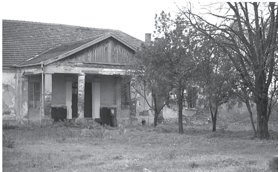
A csokalyi kúriák olyan értékek, amelyeket meg kell őrizni a következő nemzedékek számára

„A csokalyi Farkas-kúria négyhektáros telkén, mely hamarosan a székelyhídi helyhatóság tulajdonát fogja képezni, egy száz férőhelyes, idős befogadásra alkalmas öregotthon fog felépülni” – szövegezte meg a városvezetés terveit az előljáró.