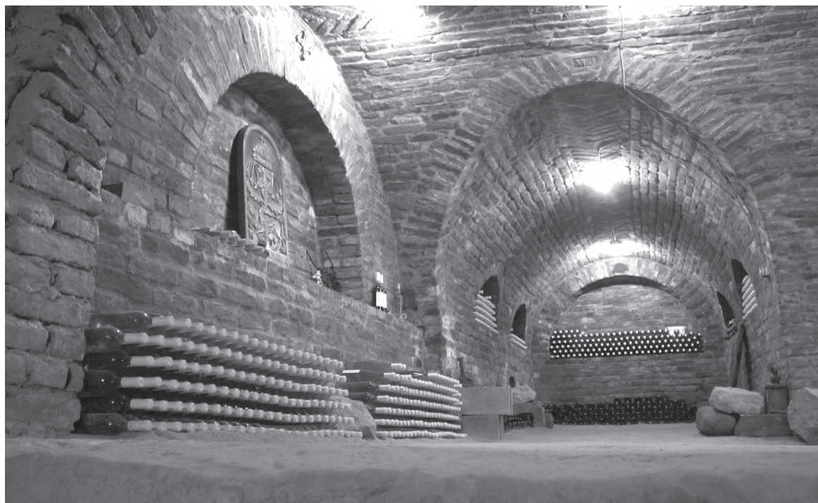
Egy két-hároméves bakator, amit fahordós érleléssel készítenek, különleges élményt nyújt