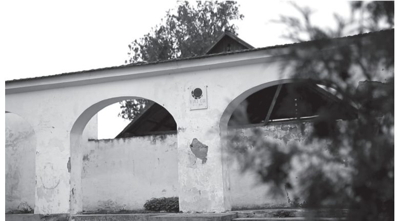
A Fényes-kúria. A kiállításon a régi és jelenlegi állapotukat is láthatjuk