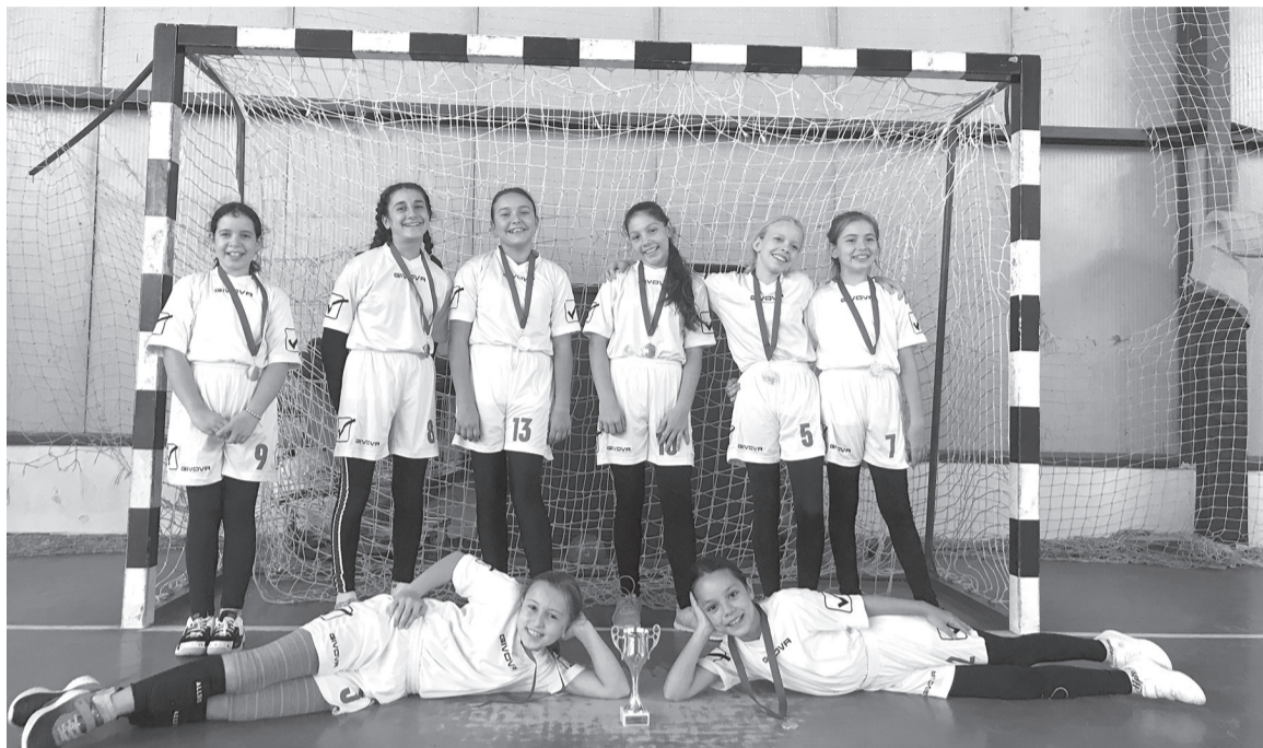
A három lánycsapat közül a legkisebbek heti két, a nagyobbak, heti három alkalommal tartanak edzéseket