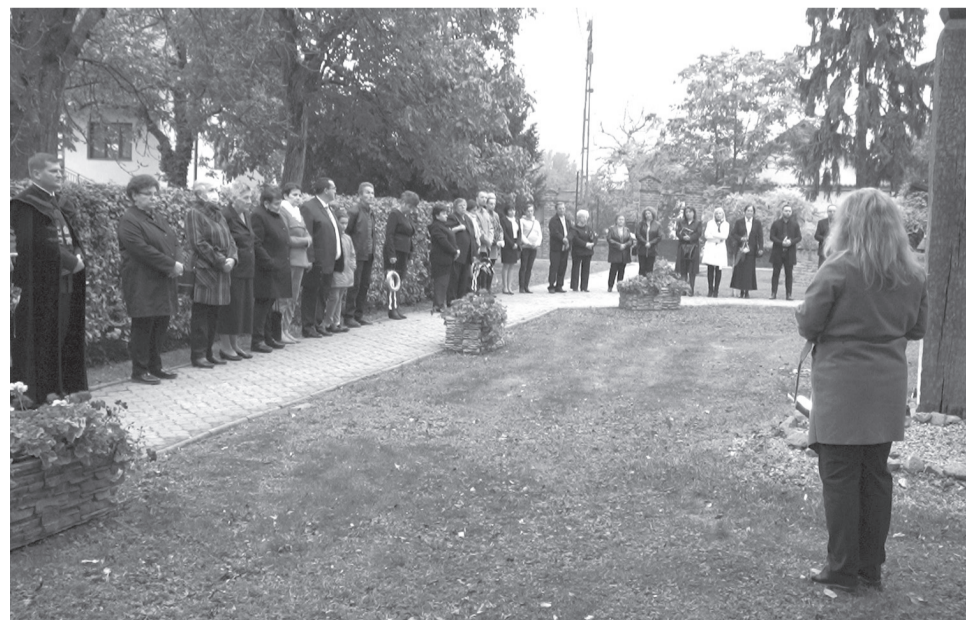
A megemlékezés résztvevői a református templomkertben lévő kopjafához vonultak