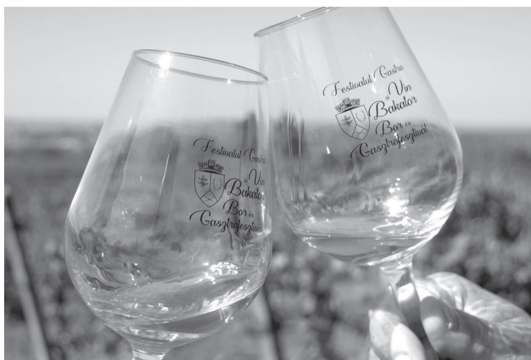
A cél az, hogy minél jobb minőségű nedű készüljön