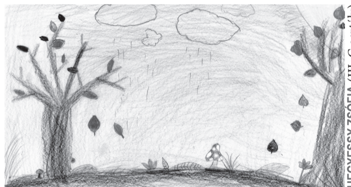
HEGYESSY ZSÓFIA (III. C osztály)