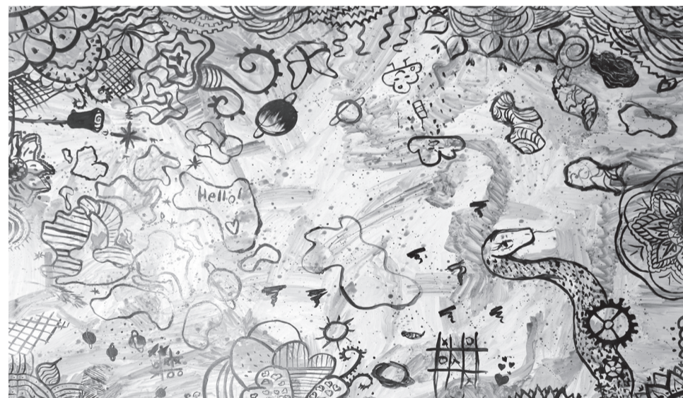
Az első alkalom végére összeállt munka a gyerekek különböző tehetségeiről árulkodik

megismétlik – a majdan születő alkotások képet adhatnak a közösen bejárt útról.