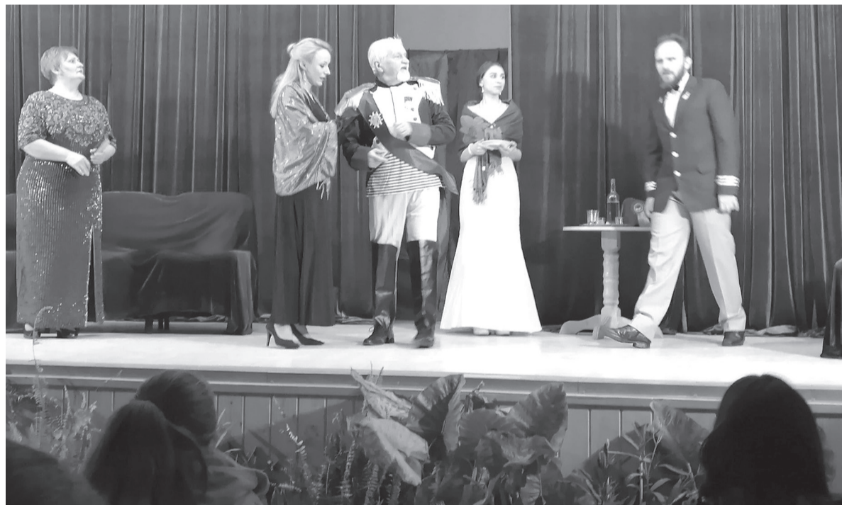
A kalandos eljegyzéstörténetben a menyasszony admirálisnak hitt édesapjáról kiderül, hogy csak színész...

Rejtő Jenő Az admirális című bohózatát láthattuk az érmihályfalvi Móka színjátszó csoport előadásában a hegyközszentmiklósi kultúrotthonban február 13-án, szombat este. Igaz, csak félig telhetett meg a kultúrház, hiszen kevés néző vehetett részt az előadásban a járványhelyzet okozta korlátozások miatt – betartva a szabályokat, üres székek és kézfertőtlenítés –, de aki eljött, jól érezte magát.