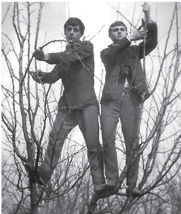
Fametszés a szalontai iskolai évek alatt