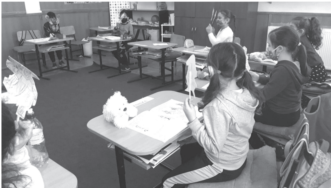
Jókedvű tanulás a Petőfi Sándor Elméleti Líceum előkészítő B osztályában. A pedagógusoknak fontos támaszpont a tanár-diák szemtől-szembe visszajelzés megléte