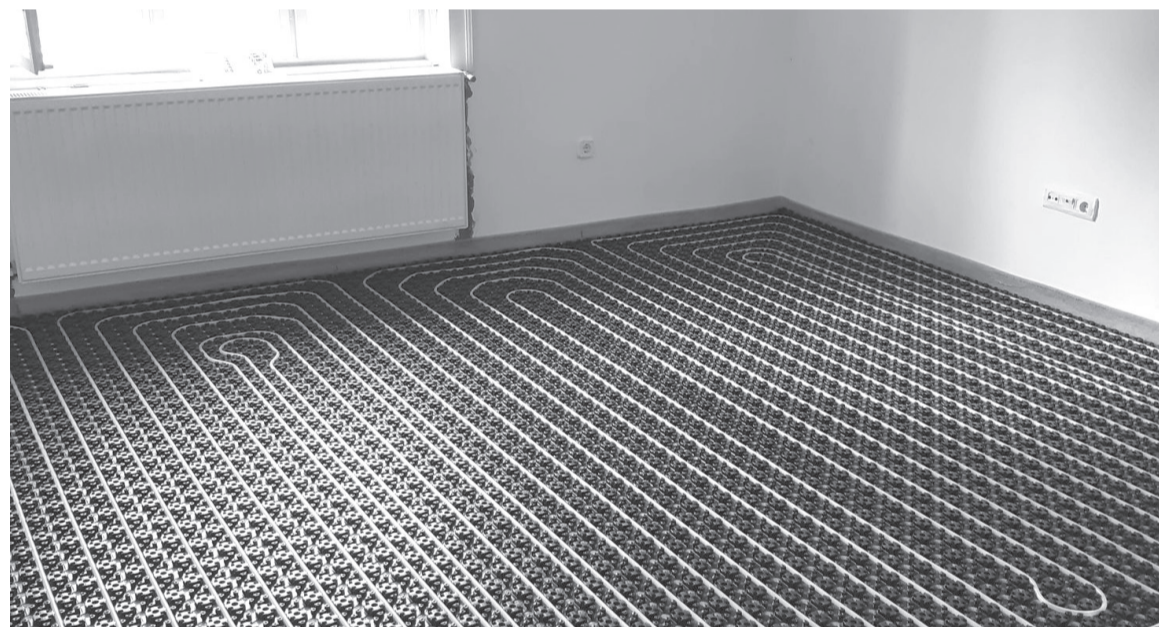
A Batori Attila által kiépített padlófűtés mellett szól az egészségi szempont is: a radiátorokkal szemben a padlófűtés nem keringeti ventilátor módjára otthonunkban a porszemcséket