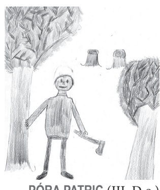
PÓRA PATRIC (III. D o.)