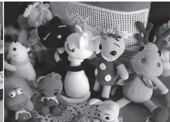
Az edelényi mézes-mázoskodás legjobbjai Gerssekarátról idevándoroltak a horgolt állatok

egy 2000 négyzetméteres, mesterségesen kialakított tó termálvízzel feltöltve.