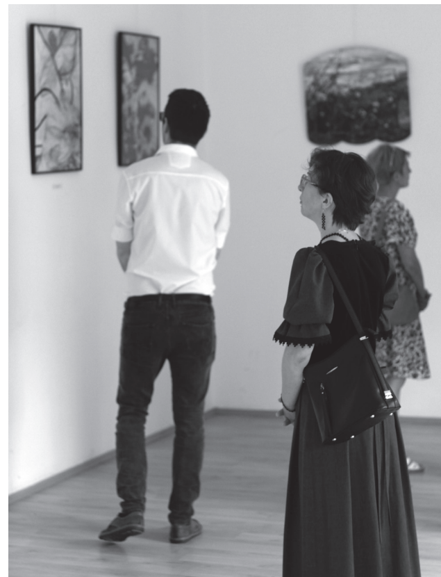
A vászonra vitt életet ki közelebből, ki távolabbról szemléli