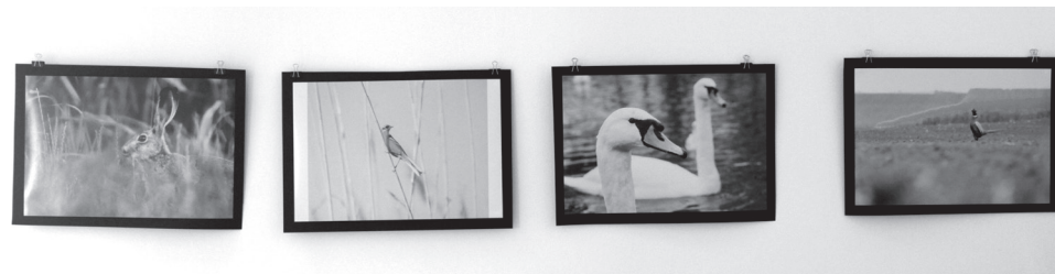
Első ízben jelent meg a közönség előtt kiállítással Sebastian Ulici 18 éves székelyhídi természetfotós