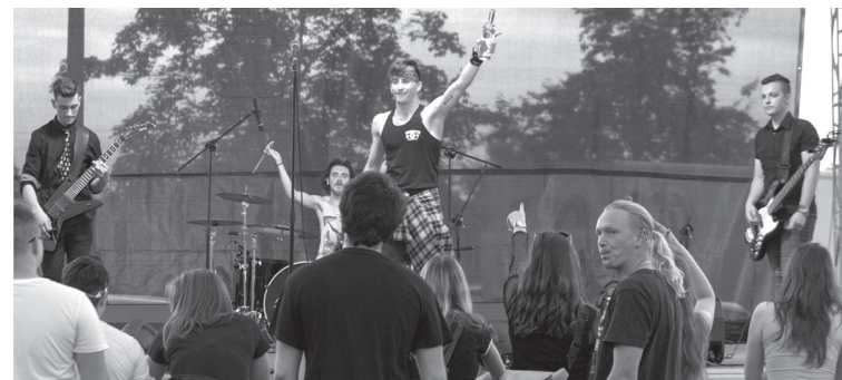
A Beatrice in Paradise lemez-bemutató koncertje a rajongókat is „eljuttatta” a Paradicsomba

indították el Romániában ezt a sportágot – hat próba, illetve versenyszám szemléltetését vállalták, magaslati favágást, fakidöntést, motoros és hagyományos láncfűrésszel történő favágást és darabolást láthatott a közönség.