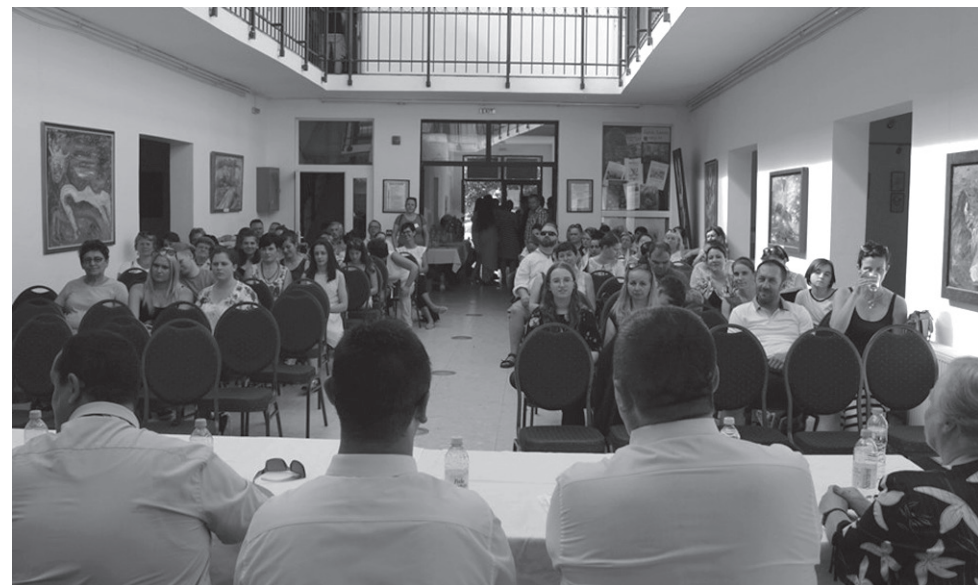
Több mint száz főt látott vendégül az Ér Hangja Egyesület városunkban a találkozót idejére

Összegyűltek a testvértelepülések képviselői a Közös értékek, közös kihívások, közös európai jövő elnevezésű, az Európai Unió égisze alatt zajló rendezvényen. A városnapokkal párhuzamosan zajló háromnapos eszmecsere pénteki megnyitóján Edeleny, Gersekarát, Nyíradony (Magyarország), Kamocsa (Felvidék), Kishegyes, Pacsér (Vajdaság) és természetesen a házigazda Székelyhíd képviselői vettek részt.