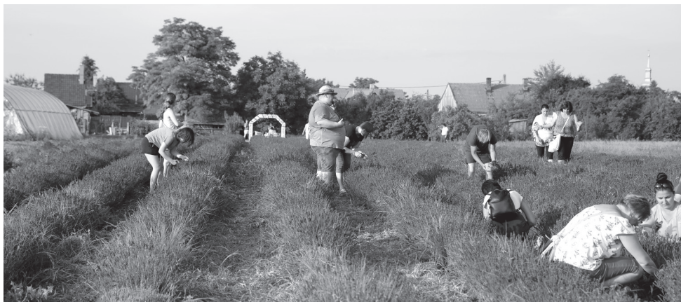
Illatos egybeesés: a levendulafarm szombati Szedd magad! akcióján a testvértelepüléseink polgárai