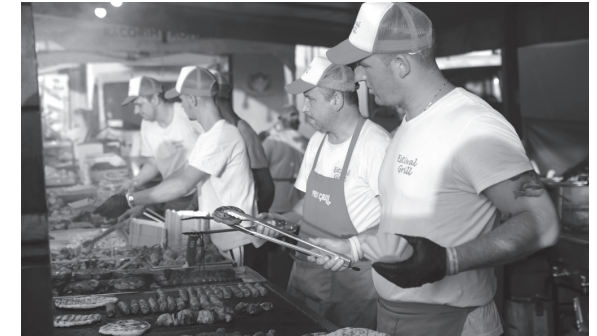
Bármí, amit roston meg lehet sütni, az megkapható