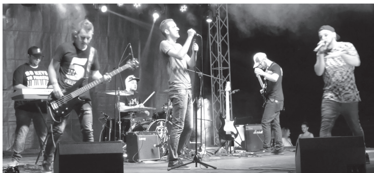
Az InFive együttes ezúttal „InSix” lett, hiszen egy taggal bővül az öttagú banda