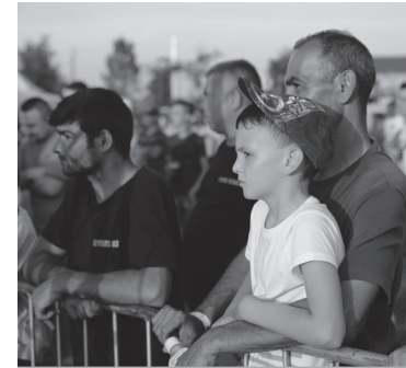
Apa-fia program, csendes nézelődés