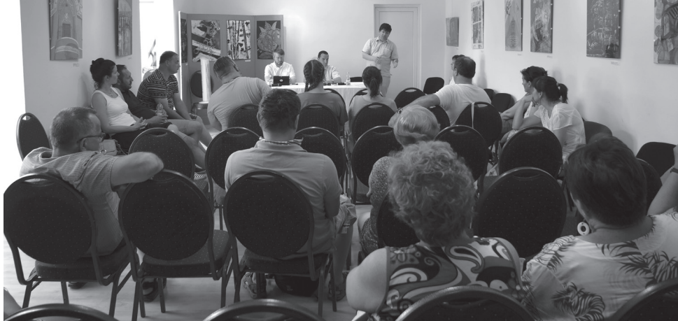
A hallgatóság bekapcsolódott az előadásokba, így megosztva kérdéseit, gondolatait az unióról

kozott Magyarország, majd az utolsóelőtti körben 2007-ben Románia (és Bulgária) lettek EU-tagok. Az EU célja egyértelműen a stabilitás létrehozása volt Európában. Az elhúzó Brexit-válsággal – azaz Nagy-Britannia kilépésével, az uniós szűkülése is felmerült fogalomként az addigi bővítések