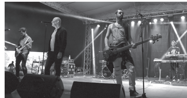
Ingyen sört nem, de jó hangulatot hozott magával a Bere Gratis