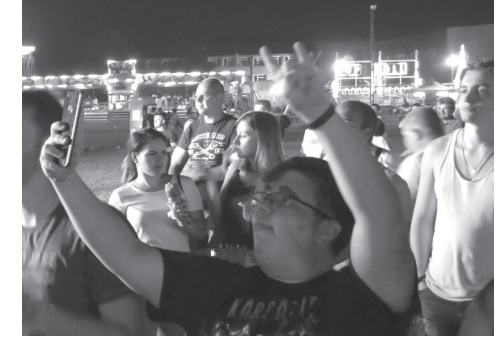
Az alfa generáció rockere: fél kéz villába szorítva, a másikban okostelefon