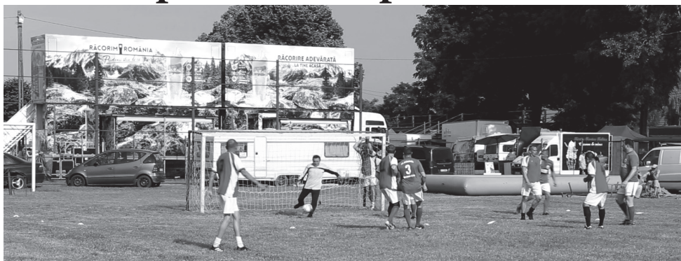
Ilyen az igaz fociszeretem: magukat nem sajnálva, a tűző napon rúgták a bőrt az öregfiúk