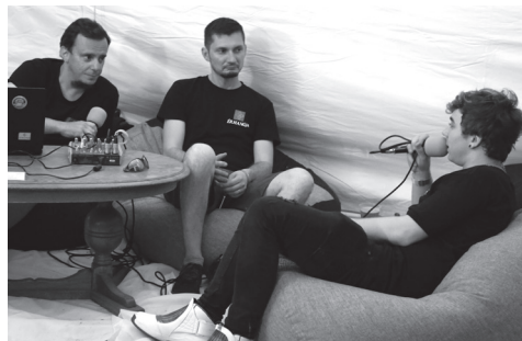
A helyi online rádió munkatársai esti szolgálatban Szabysttel készítenek interjút