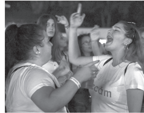
A Bere Gratis mindenkit éneklésre „beer”