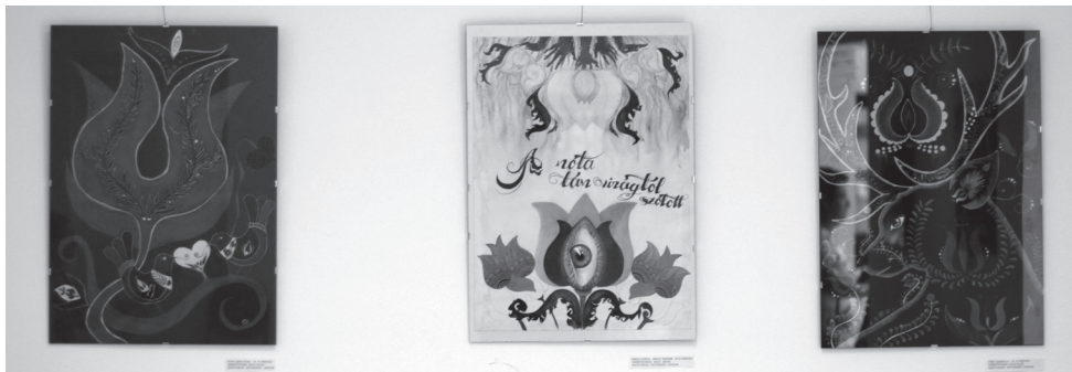
A művészeti líceum diákjai a szecessziós stílust mondhatni minden sarkon tanulmányozták Nagyváradon, hozzánk is csempészték belőle

a park kövein a táncot. A szintén gersekaráti Laudate énekkar egyházi dalokat hozott a közönségnek, majd a megnyitót a Székelyhídi Férfikórus zárta. A hivatalos megnyitó elmaradhatatlan részeként a milleniumi emlékmű ismét koszorúkkal ékesedett.