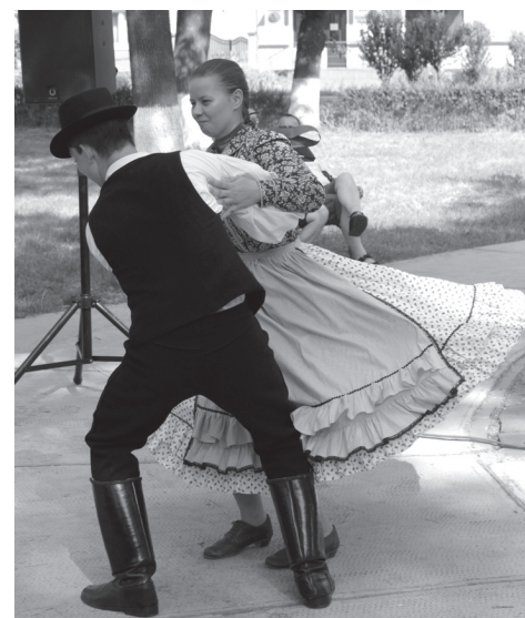
Elbűvölő mosollyal ropta a két Nyíradonyból érkezett táncos

A városnapi rendezvénysorozat hivatalos megnyitójának és a múzeumban berendezett művészeti kiállítások megnyitójának péntek délután a már megszokott ideje. És ez a megszokottság kellemes megszokás, hiszen ilyenkor a vendégek és helybeliek biztosak lehetnek benne, hogy a millenniumi parkban és szomszédos kulturális térben is meglepetések várják őket. Így például a megnyitón Béres Csaba polgármester kedves szavai és Szabó Ödön Bihar megyei parlamenti képviselő beszéde mellett kulturális kavalkád kerekedett Székelyhíd és a testvértelepülések fellépőinek köszönhetően. Az érdeklődők láthatták és hallgathatták városunk Búzavirág Népdalkörét, a gersekaráti asszonykórust, együtt mosolyoghattak a nyíradonyi fiatalokkal, akik közül első ízben egy népdalénekes trió szívhez szóló dalokat szóltatott meg, majd a Nyíradonyban méltán híres néptáncos párosa ropta istenesen