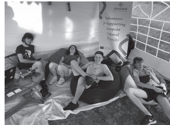
Az Ér Hangja Egyesület helyi és külföldi önkéntesei egész sátornyi foglalkozással várták a gyerekeket, fiatalokat