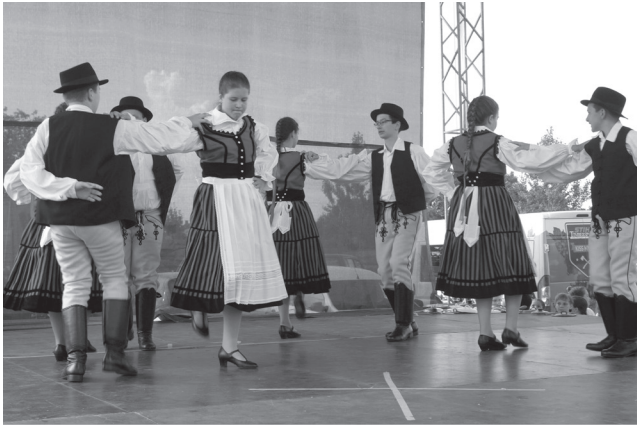
Új koreográfiákat és új, Szentegyházán készült viseleteket is bemutatott a Zajgó Néptáncsoport táncosai